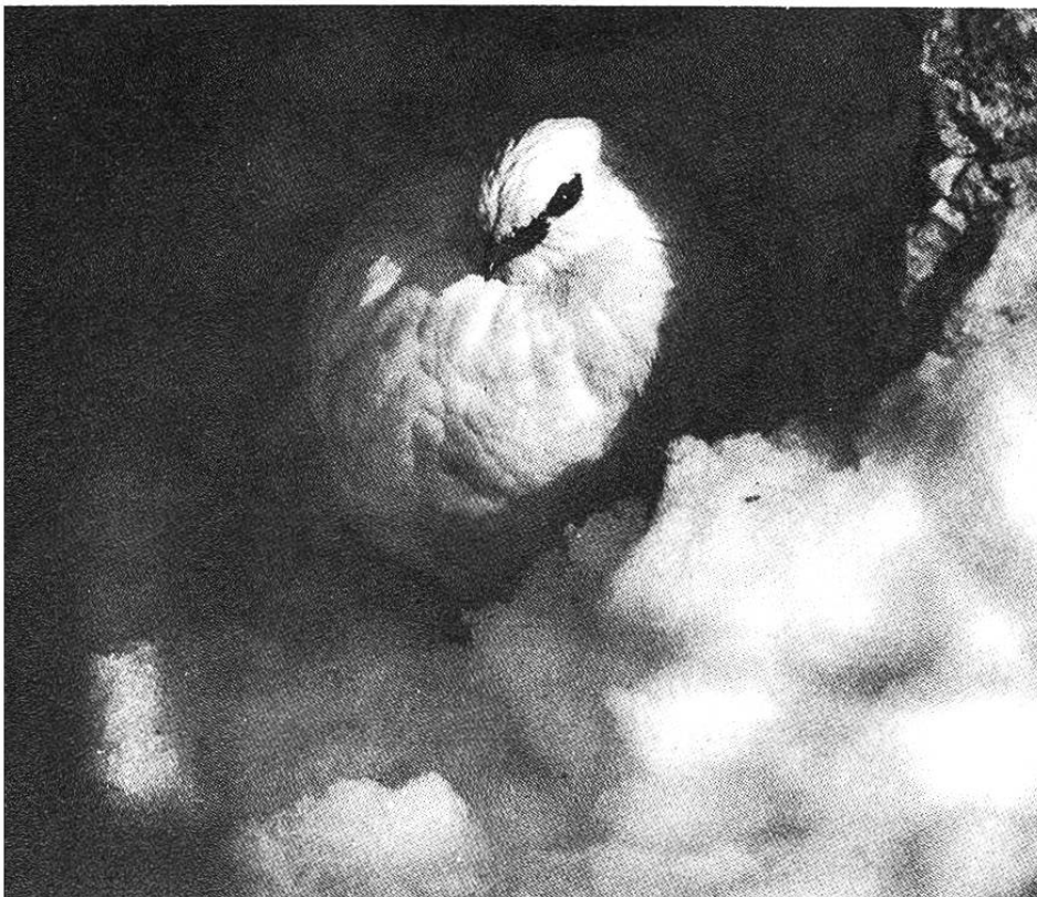
Aufgeplustert und im Windschutz verbraucht das Schneehuhn wenig Energie.

Aufgeschreckte Birkhühner geraten wie die Gamsen in Panik und fliegen oft weite Strecken, bevor sie sich beruhigen. Schon das können sich die schlecht ernährten Vögel kaum leisten. Noch schlimmer aber