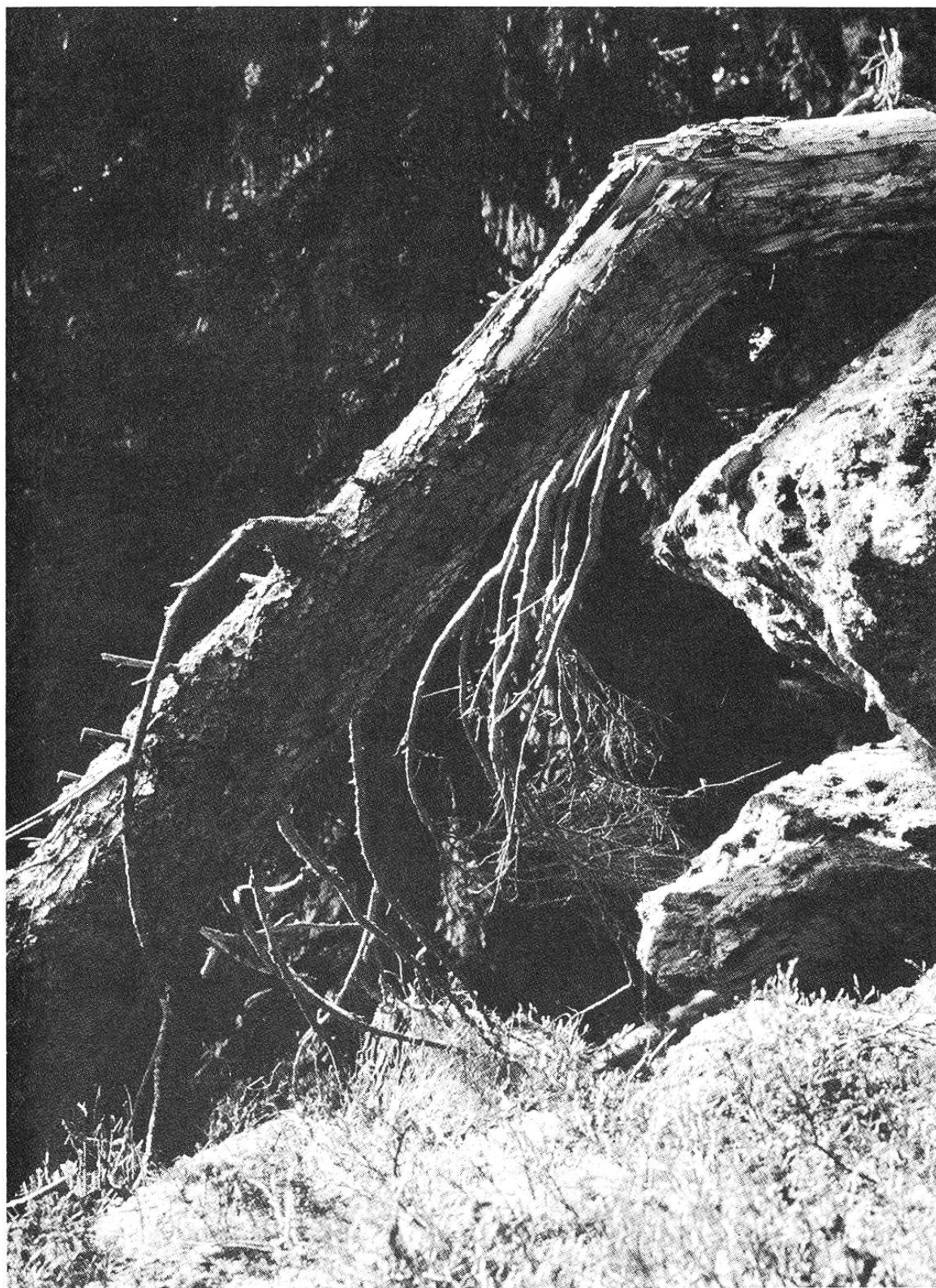
Der Urwald liegt auf einer steilen, mit Blöcken eines nacheiszeitlichen Bergsturzes übersäten Halde. Kein Wunder, dass er nie genutzt wurde.