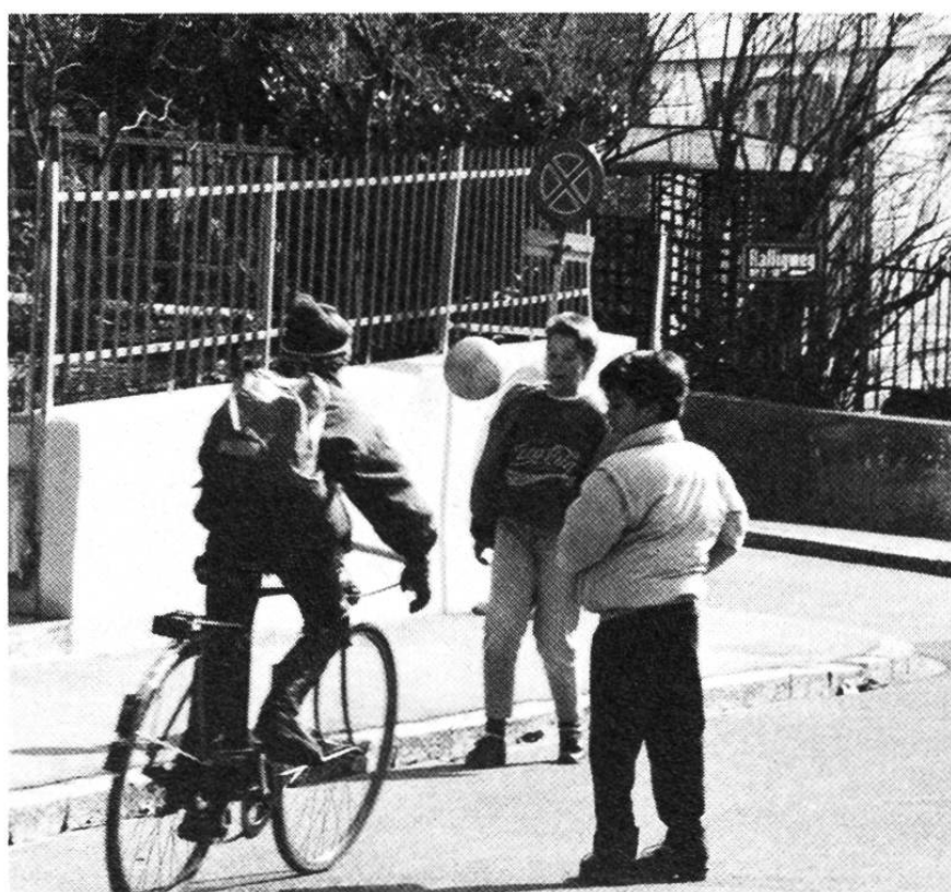
Spielen auf der Strasse — gefährlich und oft gar nicht lustig.