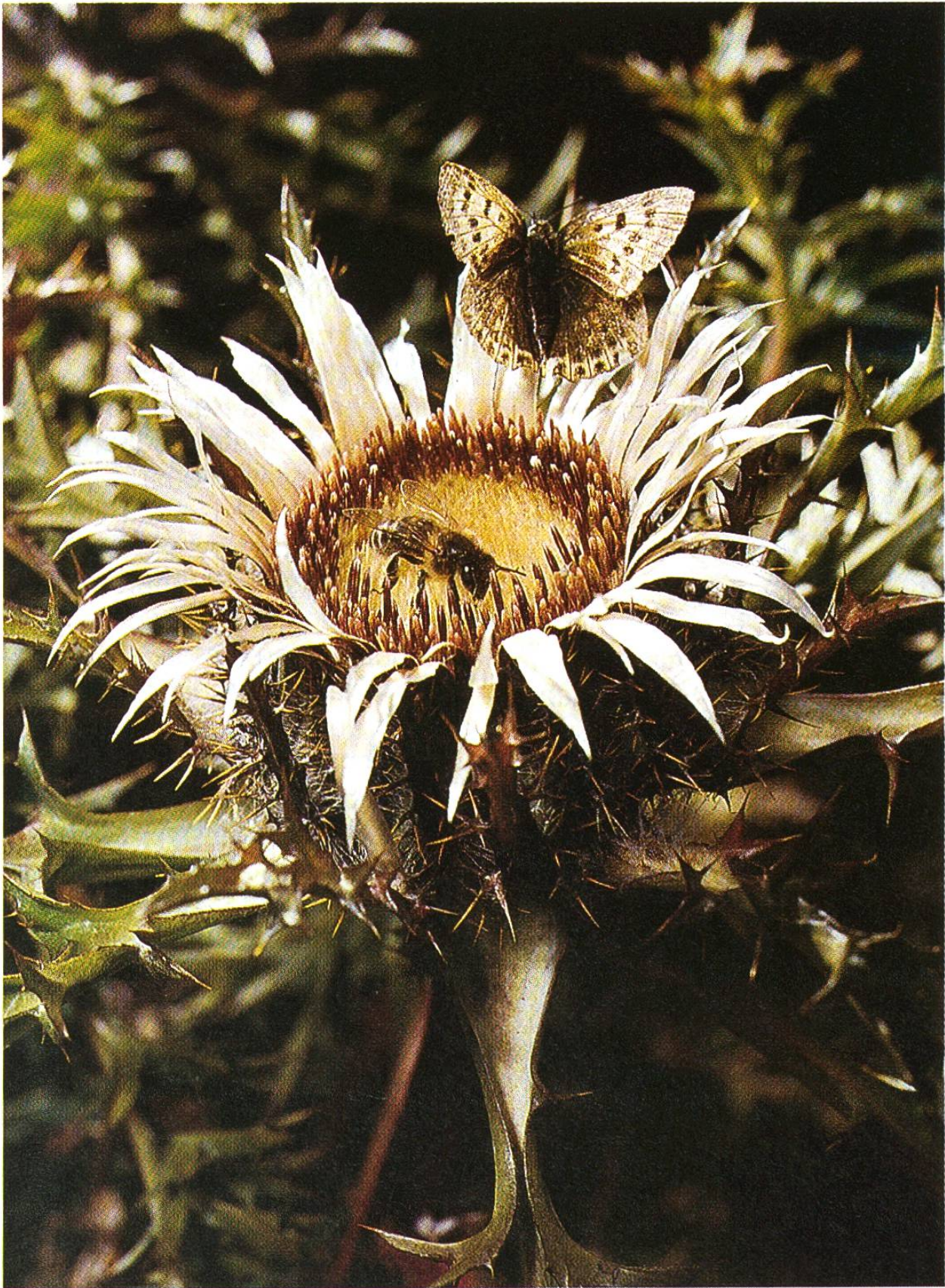
Scheinbar gewöhnlich und dennoch faszinierend: Silberdistel mit Bienen- und Schmetterlingsbesuch.