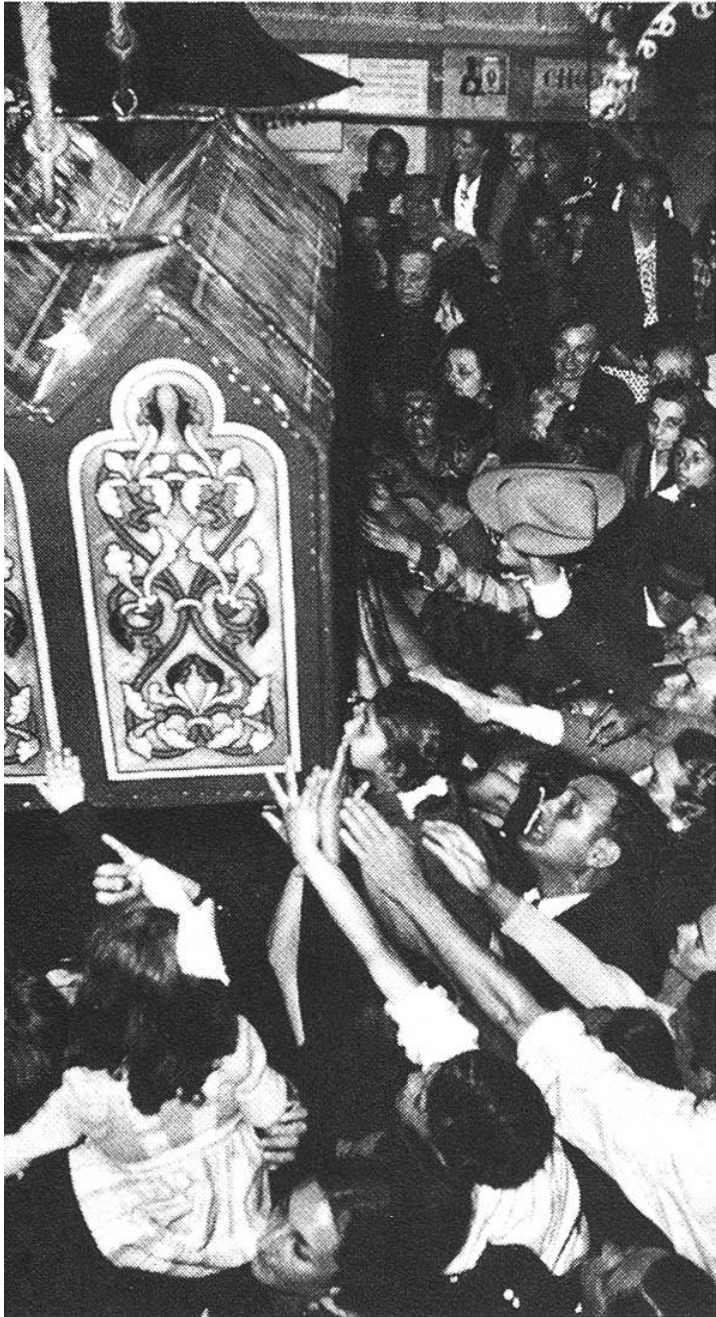
Beim Fest und am Schrein der «Heiligen Sara» kommt jeden Mai die inbrünstige religiöse Begeisterung der französischen Zigeuner zum Ausdruck. Les St-Maries-de-la-mer. (Camargue, Südfrankreich)