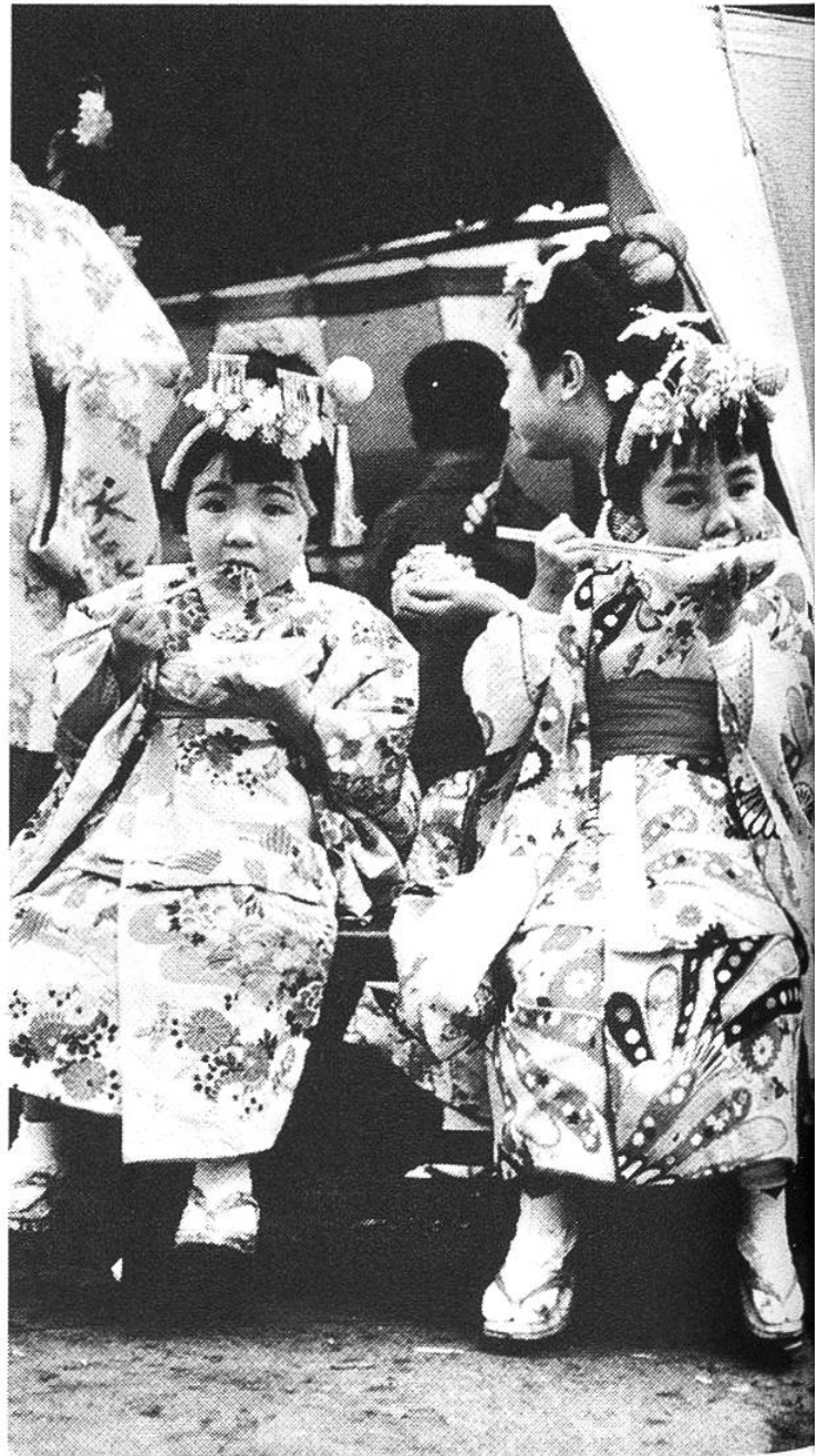
Japan ist ein Land der Kinderliebe. Am Puppenfest der Mädchen , am 3. März, werden die kleinen «Damen» besonders gekleidet, verwöhnt und beschenkt. Zwei Mädchen im traditionellen Kleid.