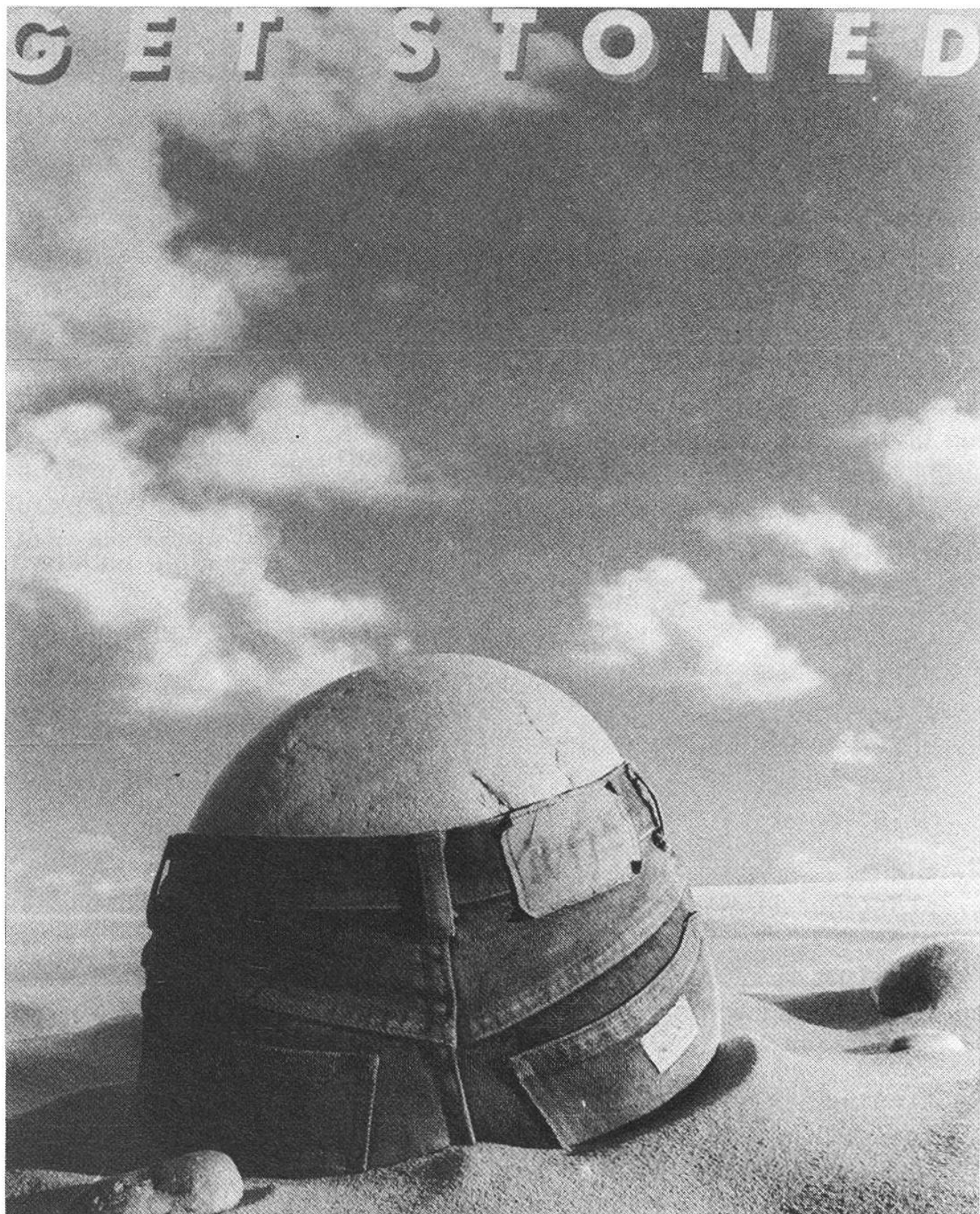
Fragwürdiges Jeans-Werbeplakat: «stoned» heisst in der Fachsprache «verladen mit Drogen».