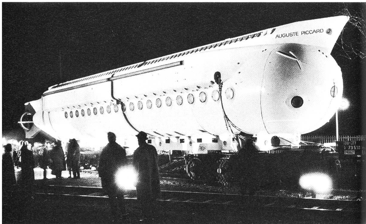
Die «Auguste Piccard» war die Publikumsattraktion der schweizerischen Landesausstellung 1964 in Lausanne. Das U-Boot führte die Besucher in die – leider sehr schmutzigen – Tiefen des Genfersees. Deutlich erkennt man über der Fensterreihe den Wulst der seitlichen Tauchtanks. Die Tiefenruder sind hier noch nicht montiert. In ihren Öffnungen greifen die Halteseile an.

strömen. Die dabei verdrängte Luft entweicht durch Ventile. Dadurch verliert der Bootskörper mehr und mehr an Auftrieb.