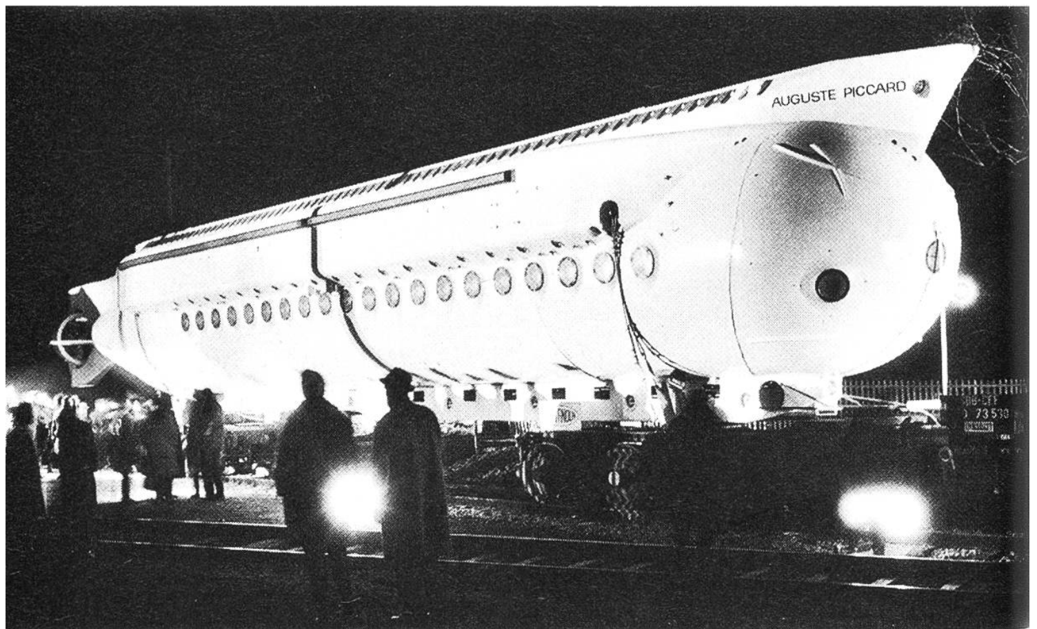
Die «Auguste Piccard» war die Publikumsattraktion der schweizerischen Landesausstellung 1964 in Lausanne. Das U-Boot führte die Besucher in die – leider sehr schmutzigen – Tiefen des Genfersees. Deutlich erkennt man über der Fensterreihe den Wulst der seitlichen Tauchtanks. Die Tiefenruder sind hier noch nicht montiert. In ihren Öffnungen greifen die Halteseile an.

strömen. Die dabei verdrängte Luft entweicht durch Ventile. Dadurch verliert der Bootskörper mehr und mehr an Auftrieb.