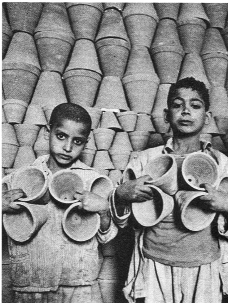
Kinder in einer ägyptischen Ziegelei: Sie stapeln die Tontöpfe im Brenn- ofen und räumen ihn aus.