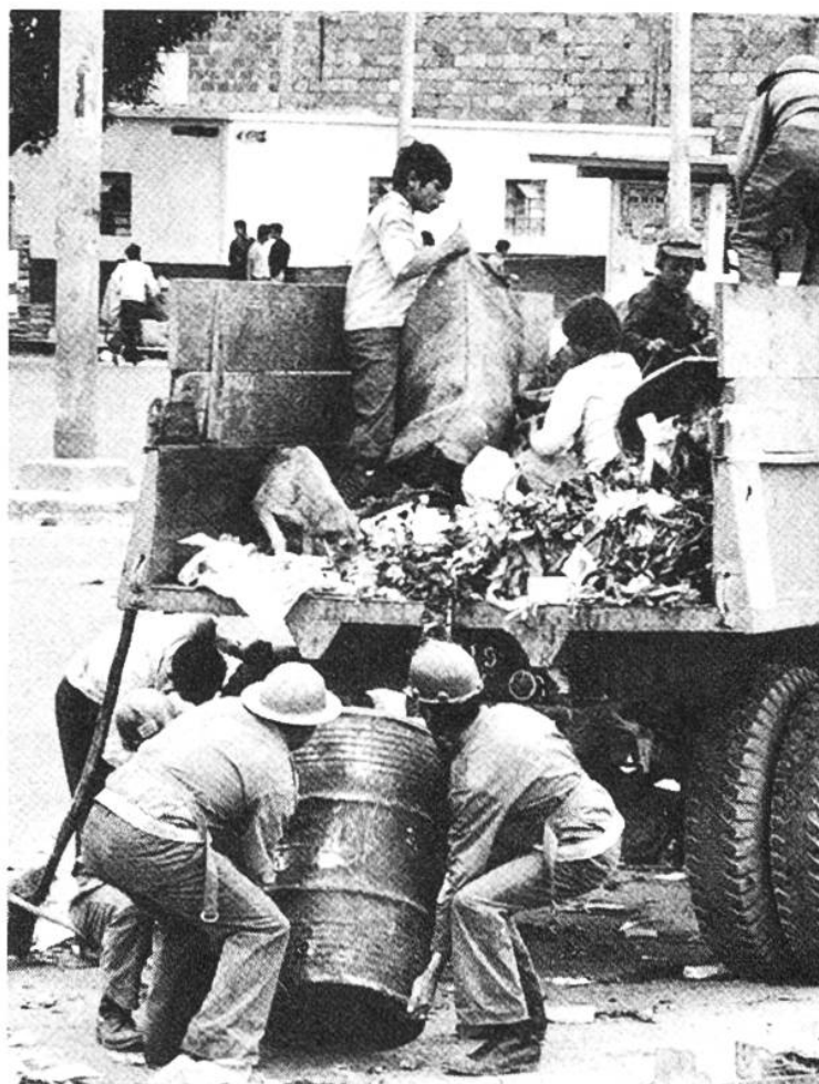
Vom Abfall der Reichen müssen die Armen leben: Auf einem Kehrichtauto in Bogotá durchstöbern Jugendliche den Unrat nach brauchbaren verkäuflichen Dingen.

Überhaupt: Die Ausbeutung der Kinder ist ein sehr dunkles Kapitel in der Sozialgeschichte fast aller Industrieländer. Dazu gehört auch die Schweiz. 1815 waren beispielsweise im Kanton Zürich 1124 Kinder im Schulalter in Spinnereien beschäftigt. Bei einem Arbeitstag von meist mehr als zwölf Stunden war es naheliegend, dass auch die älteren Fabrikkinder kaum lesen und schreiben konnten. Im Jahre 1815 erliess der Regierungsrat eine «Verordnung wegen der minderjährigen Jugend in den Fabriken überhaupt und an den Spinnmaschinen besonders». Doch die Fortschritte, die sie brachte, waren gering: Verbot der Fabrikarbeit für Kinder vor dem vollendeten 9. Altersjahr, Festlegung der täglichen Arbeitszeit bis zum vollendeten 16. Altersjahr auf 12 bis 14 Stunden, Verpflichtung des Vaters, sein in der Fabrik beschäftigtes Kind an der Repeatschule und an der Kinderlehre teilnehmen zu lassen. Die Nachtarbeit wurde nur indirekt verboten, indem ohne Festsetzung des Arbeitsschlusses bestimmt wurde, mit der Arbeit dürfe im Sommer nicht vor fünf, im Winter nicht vor sechs Uhr begonnen werden. Ein weiterer Anlauf, die Kinder von den schlechten Aus-