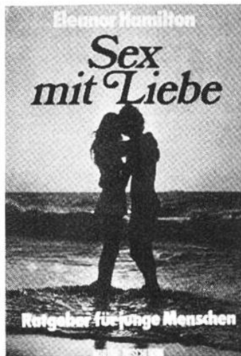
Sex mit Liebe Hamilton, Eleanor Müller

Das Erdendasein des vom reichen Bürgersohn zum Bettler sich wandelnden Franz von Assisi wird hier ergreifend erzählt. Das Buch schenkt unvergessliche Einblicke in das Leben dieses bedeutenden Menschen.