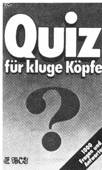
Quiz für kluge Köpfe Draeger, Wolfhart Delphin

Eine Auswahl von fast zehn Dutzend Volksliedern von Bestand, die in ihrer Einfachheit immer wieder überraschen, hier mit guten Klavierbegleitungen versehen. Zeichnungen von Richter, Pocci u.a. verschönern den Band.