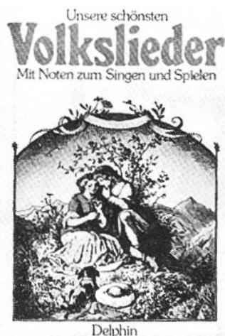
Unsere schönsten Volkslieder Haffner, Gerhard Delphin

Herrliche Weisen voller Poesie mit ansprechenden Begleitungen zur Freude von jung und alt. Die Texte erscheinen in der Originalsprache und in guter Übersetzung.