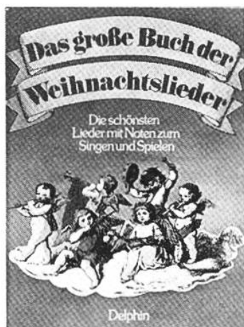
Das grosse Buch der Weihnachts- lieder Haffner, Gerhard Delphin

Der Herausgeber hat hier 70 schönste Lieder zur grossen Festzeit ausgewählt und mit einfachen und doch originellen Begleitungen bereichert. Die Bilder erfreuen jung und alt.