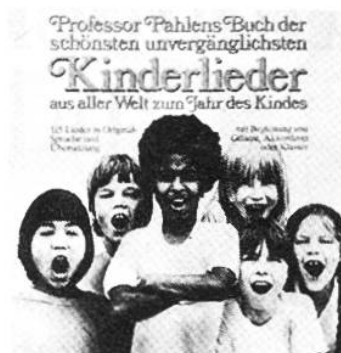
Die schönsten Kinderlieder aus aller Welt Pahlen, Kurt Schweizer Verlagshaus

Der Herausgeber hat hier 70 schönste Lieder zur grossen Festzeit ausgewählt und mit einfachen und doch originellen Begleitungen bereichert. Die Bilder erfreuen jung und alt.