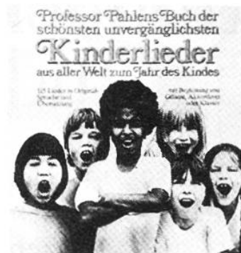
Die schönsten Kinderlieder aus aller Welt Pahlen, Kurt Schweizer Verlagshaus

Der Herausgeber hat hier 70 schönste Lieder zur grossen Festzeit ausgewählt und mit einfachen und doch originellen Begleitungen bereichert. Die Bilder erfreuen jung und alt.