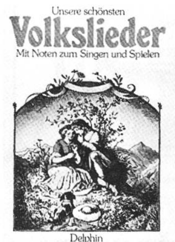
Unsere schönsten Volkslieder Haffner, Gerhard Delphin

Herrliche Weisen voller Poesie mit ansprechenden Begleitungen zur Freude von jung und alt. Die Texte erscheinen in der Originalsprache und in guter Übersetzung.