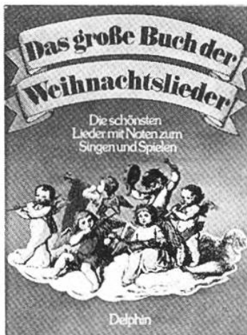
Das grosse Buch der Weihnachts- lieder Haffner, Gerhard Delphin

Der Herausgeber hat hier 70 schönste Lieder zur grossen Festzeit ausgewählt und mit einfachen und doch originellen Begleitungen bereichert. Die Bilder erfreuen jung und alt.