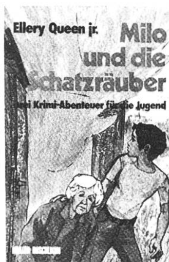
Milo und die Schatzräuber Queen jr., Ellery Müller

Um 1805 segelt der elfjährige Schiffsjunge Sandy nach dem Persischen Golf. Ein grausamer Überfall durch afrikanische Piraten macht ihn zum Sklaven des Kapitäns des Räuberschiffes. Die Geschichte ist nach alten Logbüchern gestaltet.