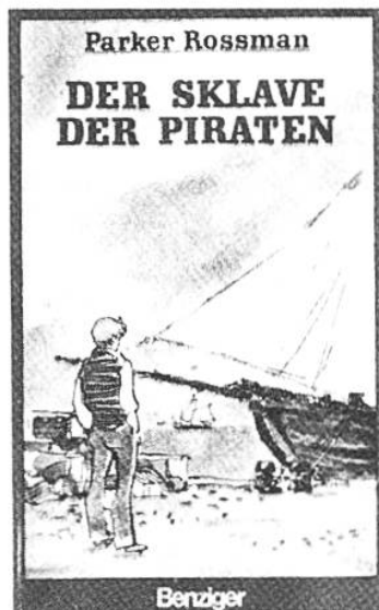
Der Sklave der Piraten Rossman, Parker Benziger

Um 1805 segelt der elfjährige Schiffsjunge Sandy nach dem Persischen Golf. Ein grausamer Überfall durch afrikanische Piraten macht ihn zum Sklaven des Kapitäns des Räuberschiffes. Die Geschichte ist nach alten Logbüchern gestaltet.