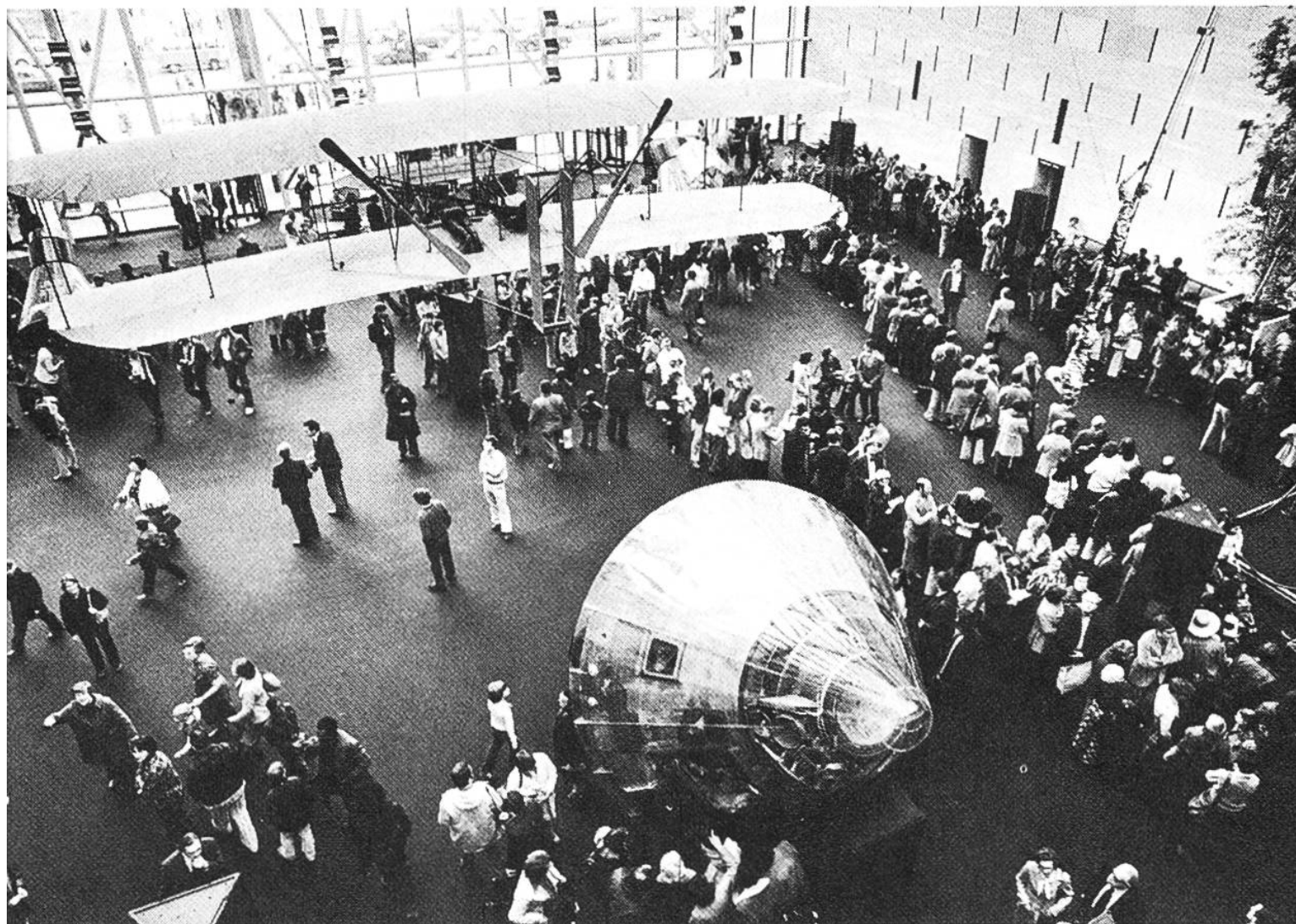
Meilensteine der Luft- und Raumfahrt: Im Hintergrund der Doppeldecker der Brüder Wright, vorn eine Apollo-Kommandokapsel, zum Schutz gegen allzu neugierige Besucher in eine Plexiglashülle verpackt.

Es ist das Luft- und Raumfahrt-Museum der Superlative. 275 Flugzeuge und gegen 100 Raumschiffe, Raketen, Satelliten und andere Raumflugkörper sind da ausgestellt – viele von ihnen Originale, echte «Antiquitäten der Technik», Reliquien der Aviatik und Astronautik, die seinerzeit Geschichte machten und heute in diesem Museum der Nachwelt erhalten bleiben.