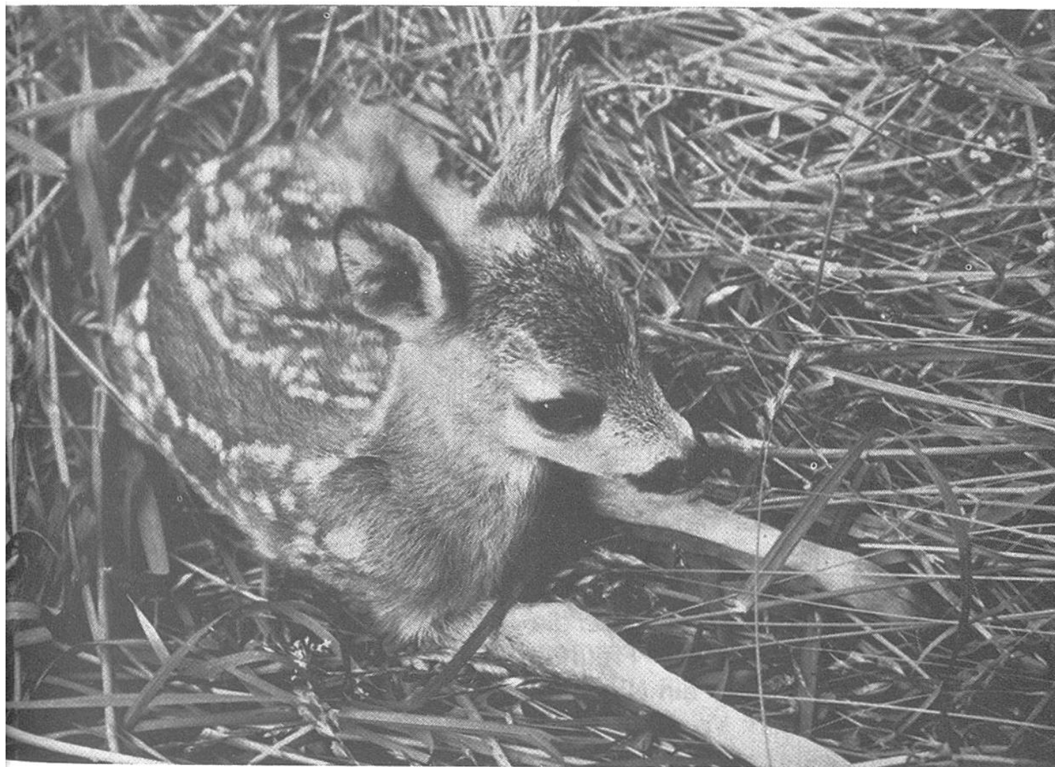
Ein neugeborenes Rehkitz, das gerettet werden konnte.

gelassen werden, stellen eine grosse Gefahr dar, weil sich die Tiere damit verletzen oder vergiften können. Reisse auch die glitzernden Folien an den Waldrändern nicht ab. Sie werden von den Jägern angebracht, damit die Tiere im Dunkeln beim Herannahen eines Fahrzeuges gewarnt und am Überqueren der Strasse gehindert werden. Aber auch das selbständige Füttern des Wildes