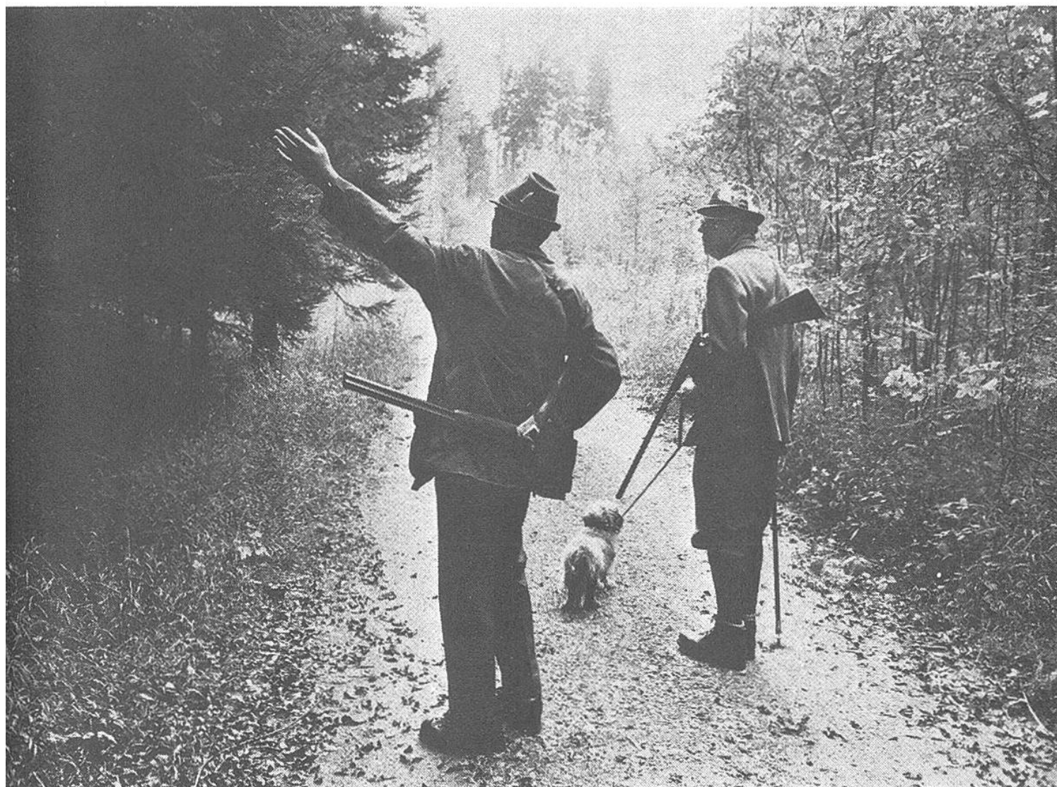
Zwei Jäger bei einem Reviergang. Alles wird kontrolliert, das Wild beobachtet und im Wald für Ordnung gesorgt.

Wildfutter an eine geschützte Stelle zu bringen, damit die Tiere auch während der schneereichen Monate genügend Nahrung finden. Sonst fressen sie die jungen Triebe der Bäume und schädigen den Wald. Diese Futterstellen müssen dann regelmäßig nachgefüllt werden, und gar oft gilt es auch, schwächere Tiere aus den grossen Schneemassen zu befreien.