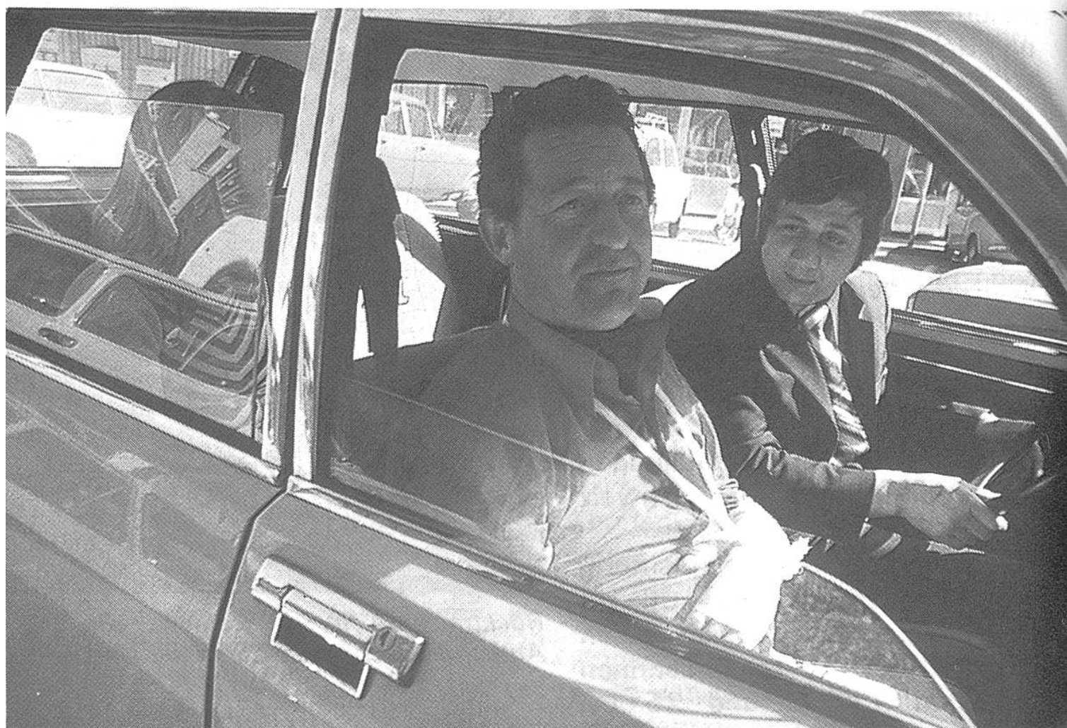
Ein Automobilist hat die Hand gebrochen: Er wird in seinem Auto nach Hause gebracht.

Am 15. Oktober trafen die ersten Nachrichten von der Schweizer Botschaft in Neu-Delhi bei der Alarmzentrale ein, die über den Zustand der jungen Leute orientierten: «Beide Verletzten leiden unter Schockeinwirkung und werden intensiv gepflegt. Eine erste Operation wurde vorgenommen. Der schnelle Transport von Rishikesh nach Neu-Delhi rettete Fräulein M. das Leben. Trotz aussergewöhnlichen hygienischen Massnahmen besteht grosse Infektionsgefahr.