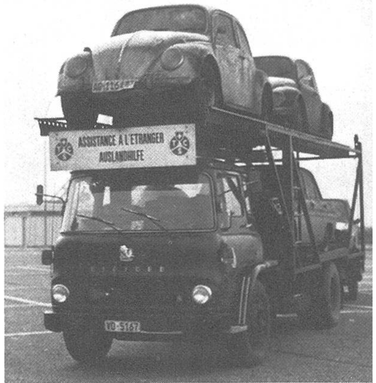
Rücktransport in die Schweiz von Autos, die nicht mehr fahrfähig sind.

schwere Brandverletzungen erlitten. Einen Tag nach dem tragischen Vorfall erhielt die Alarmzentrale von den Schweizer Behörden, die durch deutsche Touristen von diesem Unfall gehört hatten, ein Telegramm. Demzufolge ereignete sich die Gasflaschenexplosion am 12. Oktober in Rishikesh, einem kleinen Dorf, in dem G.B. und C.M. unter primitivsten Verhältnissen notdürftig gepflegt wurden. Zwei Tage später überführte man die beiden Schwerverletzten nach Neu-Delhi. Dort konnte man in einer Klinik die ersten dringendsten chirurgischen Eingriffe vornehmen.