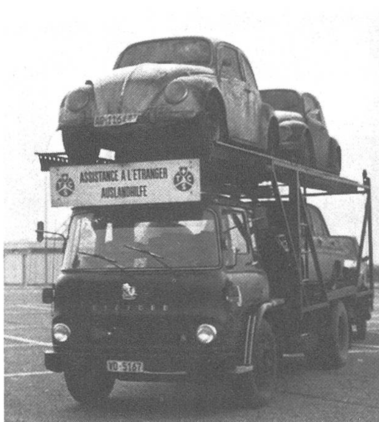
Rücktransport in die Schweiz von Autos, die nicht mehr fahrfähig sind.