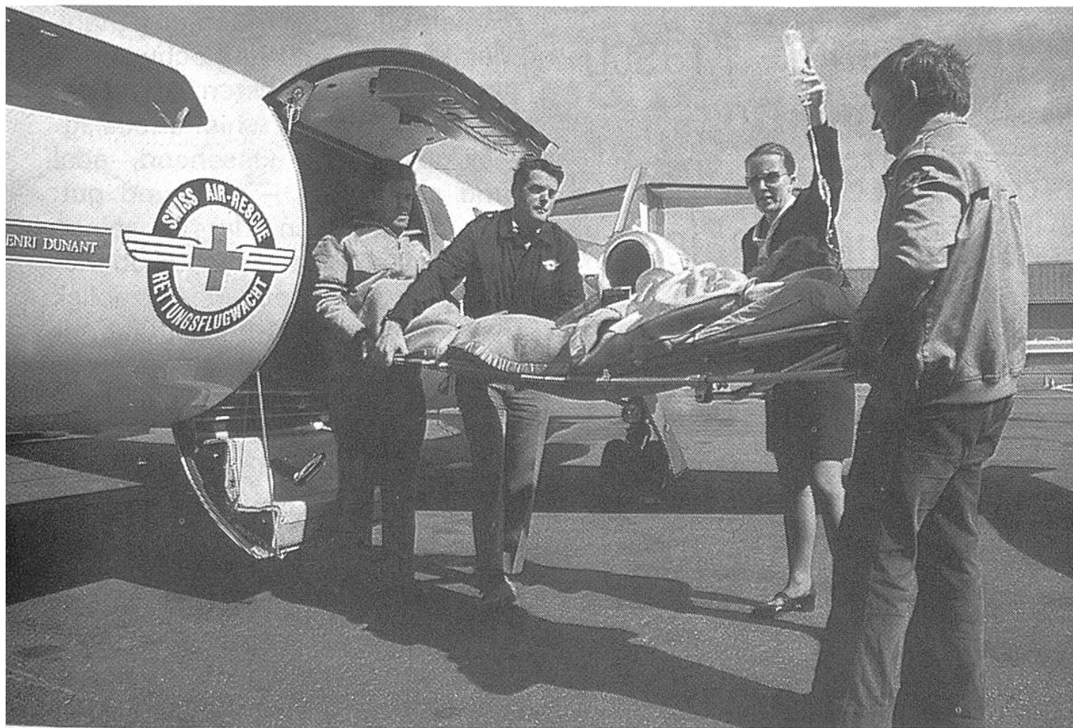
Schwerverletzt im Ausland: die Alarmzentrale vermittelt Hilfe.

sung der Schweizer Touristen entschloss man sich für die Heim-schaffung mit einem Flugzeug der Schweizerischen Rettungsflugwacht (SRFW). Am 20. Oktober startete in Zürich ein Lear-Jet der SRFW mit ärztlichem Begleitpersonal. Am 21. Oktober landete das Flugzeug mit den Verletzten an Bord bereits wieder in Kloten. Sie wurden dann unverzüglich ins Zürcher Kantonsspital überführt und erhielten dort die nötige Pflege.