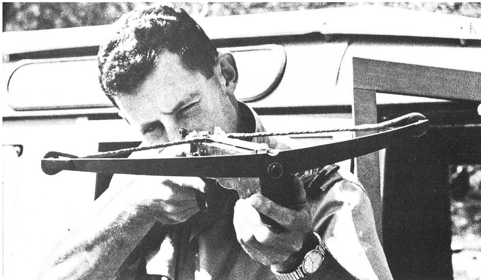
Die neuentdeckte Armbrust mit dem aufliegenden Drogenpfeil, der hier auf eine Antilope abgeschossen wurde.

1961 die ersten Exemplare im Krügerpark an. Der Zeitschrift «Südafrikanisches Panorama» zufolge sollen solche Transporte heute an der Tagesordnung sein. Nach der «Schuss-Spritze» werden die Nashörner zuerst ein paar Tage in Verschlagen gehalten, damit sie sich an die Anwesenheit von Menschen gewöhnen, die sie auf dem Transport begleiten. Die Tiere werden von den Park-Rangers routinemässig mit dem Drogenpfeil geschossen, der sie innerhalb von drei bis vier Minuten in Schlaf sinken lässt. Die flüchtenden Dickhäuter müssen unterdessen mit dem Pferd verfolgt werden, wenn kein Helikopter zur Verfügung steht, der die ganze Szene verfolgen kann.