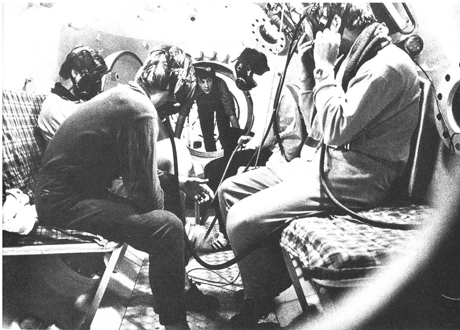
Die Wohnkammer des Zürcher Tauchsimulators. Der Durchstieg im Hintergrund führt in ein kugelförmiges Abteil, unter dem sich eine zweite, wasser-gefüllte Kugel befindet. In dieser können realistische Unterwasser-Experimente durchgeführt werden.

bar der Trunkenheit durch Alkohol. In grösseren Tiefen stellt sich rasch Bewusstlosigkeit ein. Schon leichter Tiefenrausch indessen kann den Taucher zu falschem Verhalten verleiten, und das bedeutet unter Wasser leicht den Tod.