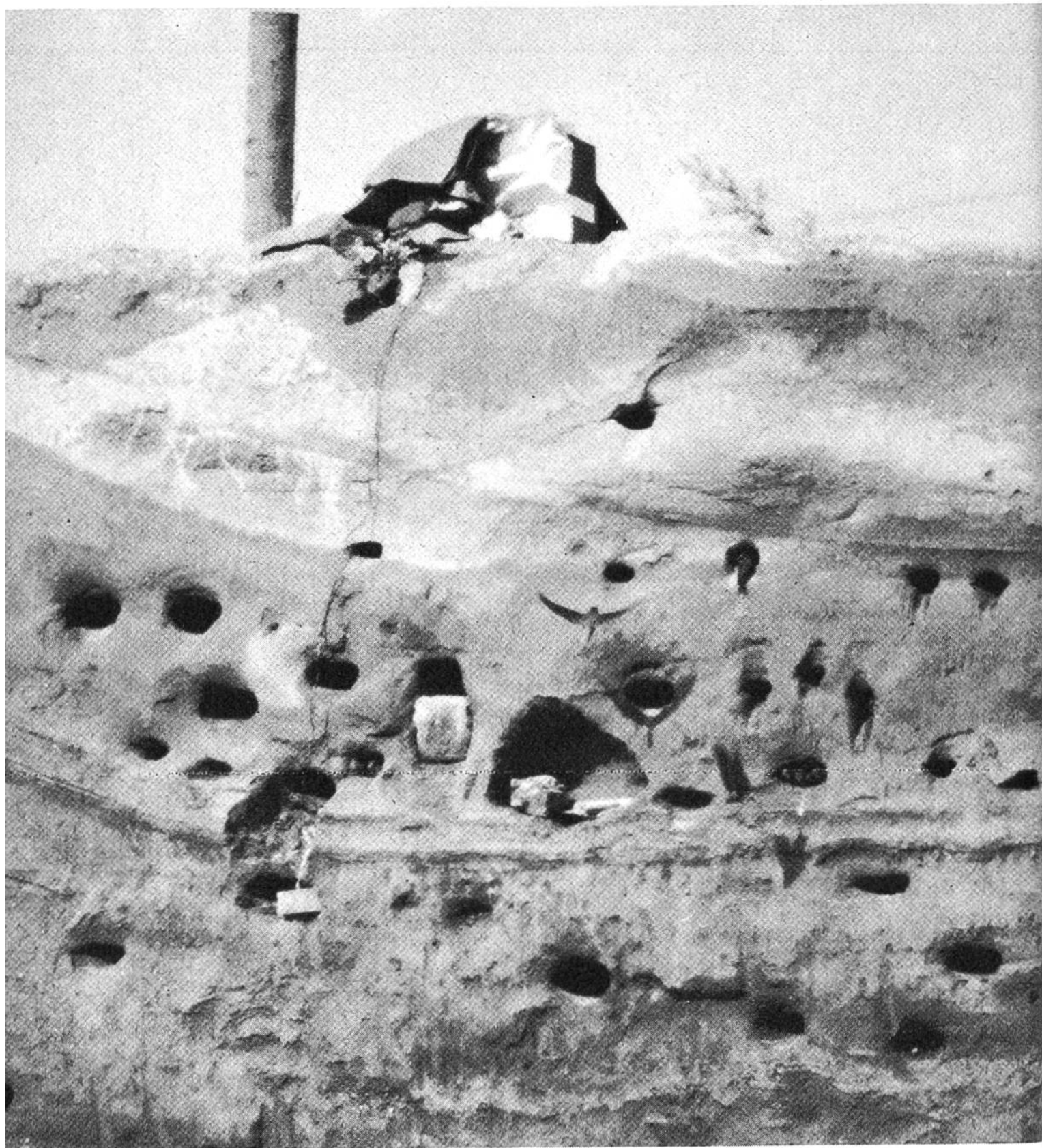
Teilansicht der Kolonie Nr. 2, an der ich die meisten Untersuchungen durchführte.