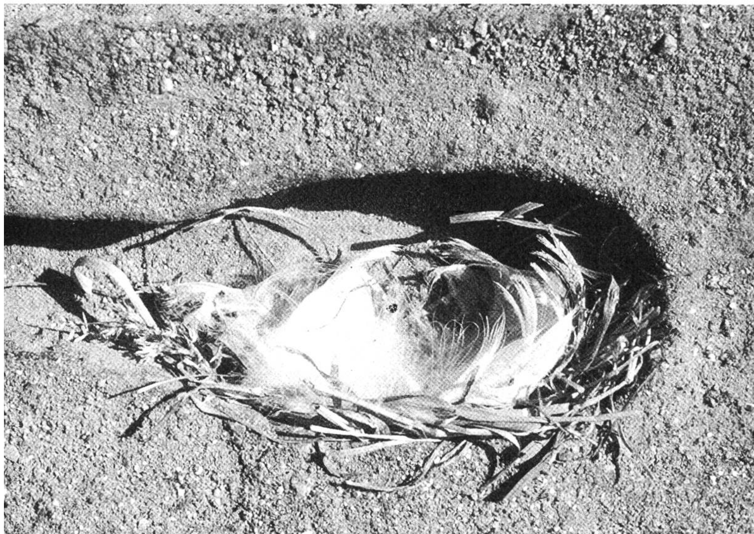
Längsschnittaufnahme eines Uferschwalbennestes. Das Nest aus Grashalmen ist mit Federn ausgeschmückt.

rücklassen und 1,25 km vom Nest entfernt im Schilf übernachten. Während mehrerer Wochen musste ich oft meine Arbeit unter schwierigen Verhältnissen vorantreiben. Im Sommer 1973 regnete es aussergewöhnlich viel. Es kam vor, dass ich während solcher Regentage keine trockene Stelle in meinem Zelt fand. Alles war feucht und starrte vor Schmutz. Meine Bücher und Schreibblätter verformten sich langsam, das Kochsalz wurde steinhart, Schnecken krochen plötzlich im Zelt umher usw. Ich