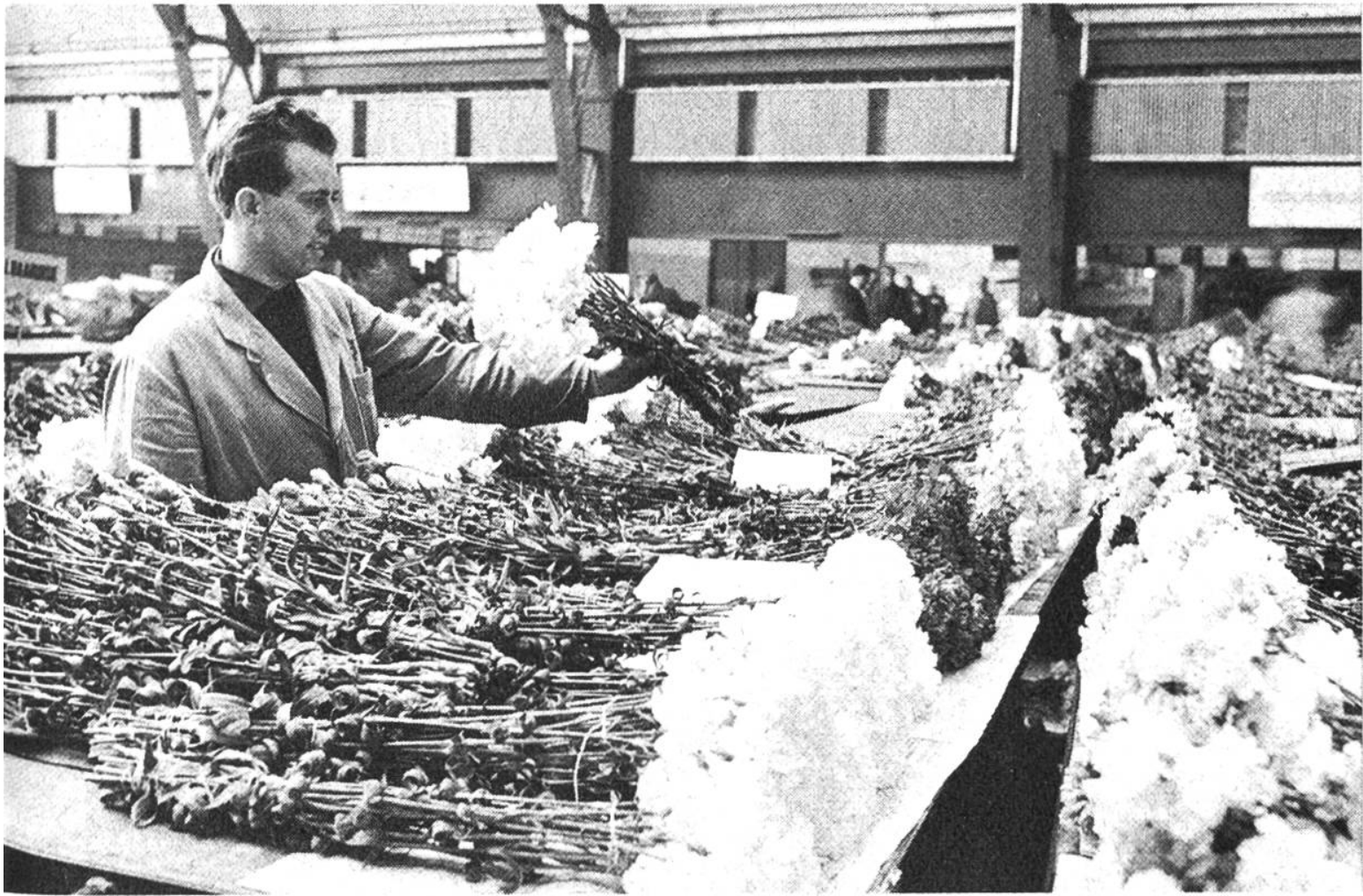
Tausende von empfindlichen, kurzlebigen Nelken liegen nach der Auktion im Versandraum zum Abtransport bereit. Die Käufer haben nur noch die Transportaufträge zu erteilen.

Rolltischen werden die bereits sorgfältig nach Qualität sortierten Warenposten in den Raum geschoben, der dem Hörsaal einer Universität gleicht. Ein paar wenige Hinweise genügen, und jeder Händler ist genau im Bild, welches die Eigenschaften der angebotenen Ware sind. Die Auktionsbeamten genießen volles Vertrauen. Auf der riesigen Auktionsuhr, welche die Vorderwand der Halle beherrscht, setzt sich nun der Zeiger in Bewegung und gleitet an Zahlen vorbei, die den Preisen entsprechen. Durch Knopfdruck kann