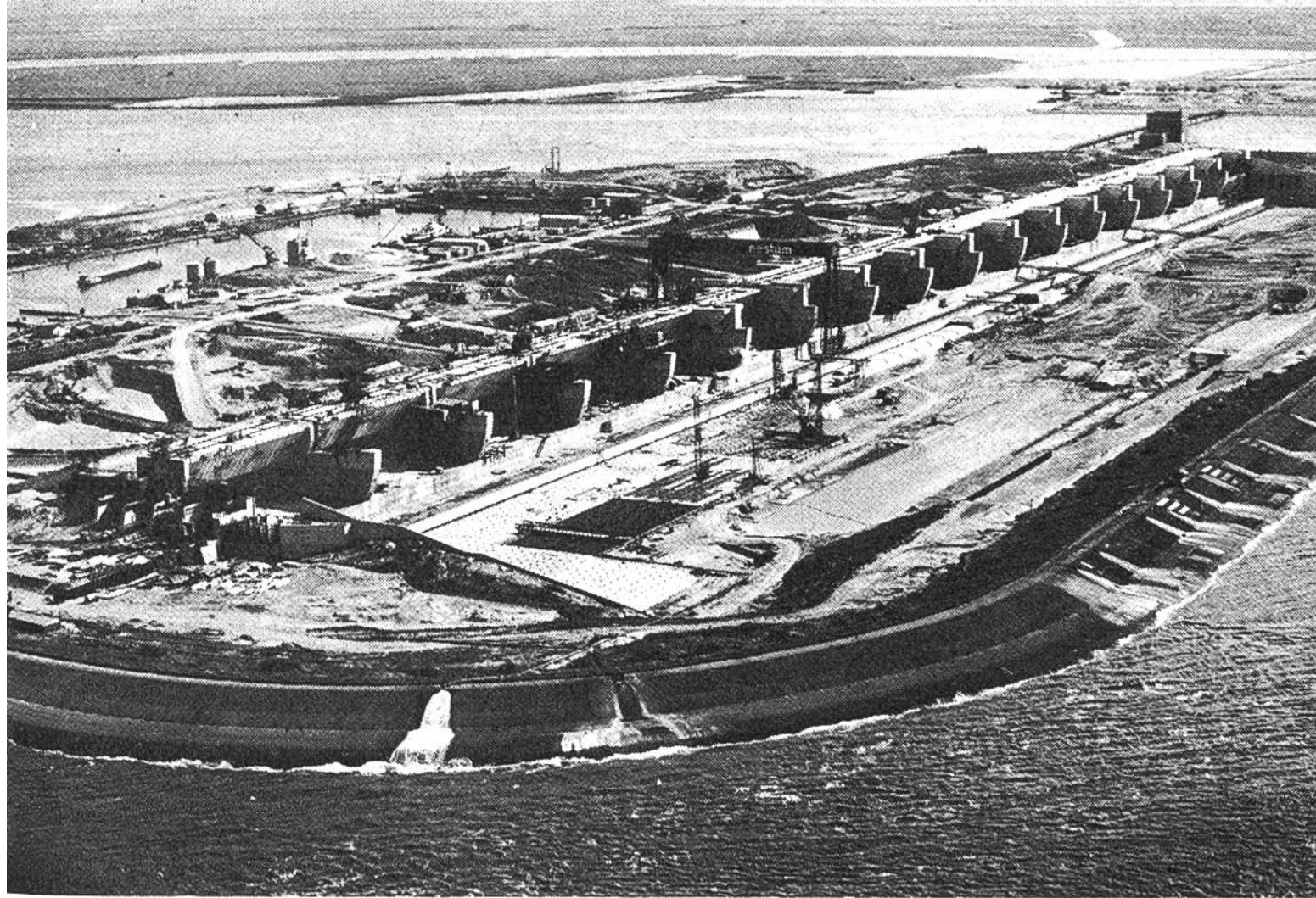
Deltawerk im Bau. Im Haringvliet, einem der heute abgeriegelten Meeresarme, werden hier auf einer künstlichen Insel siebzehn Schleusen erstellt. Die Deichbauten dürfen nämlich den regen Wasserverkehr nicht beeinträchtigen.

von Wasseringenieuren heranwachsen lassen. Zwei Angriffspunkte bietet Holland der Nordsee dar: die Zuidersee und den gemeinsamen Mündungstrichter von Rhein und Maas. Durch den kühnen Abschlussdeich, gegen den nun die Sturmfluten vergeblich anrennen, ist im Jahre 1936 die Zuidersee zu einem friedlichen Binnenmeer geworden. Millionen von Menschen rund um den heutigen IJsselsee konnten damals aufatmen. Eine ähnliche Sicherung des