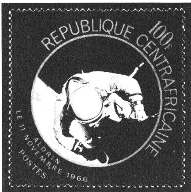
République Centrafricaine 100F, Aldrin, le 11 Novembre 1966, Postes Weltraum-Spaziergang