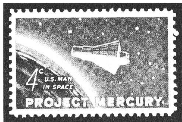
U.S. Man in Space 4c, Project Mercury