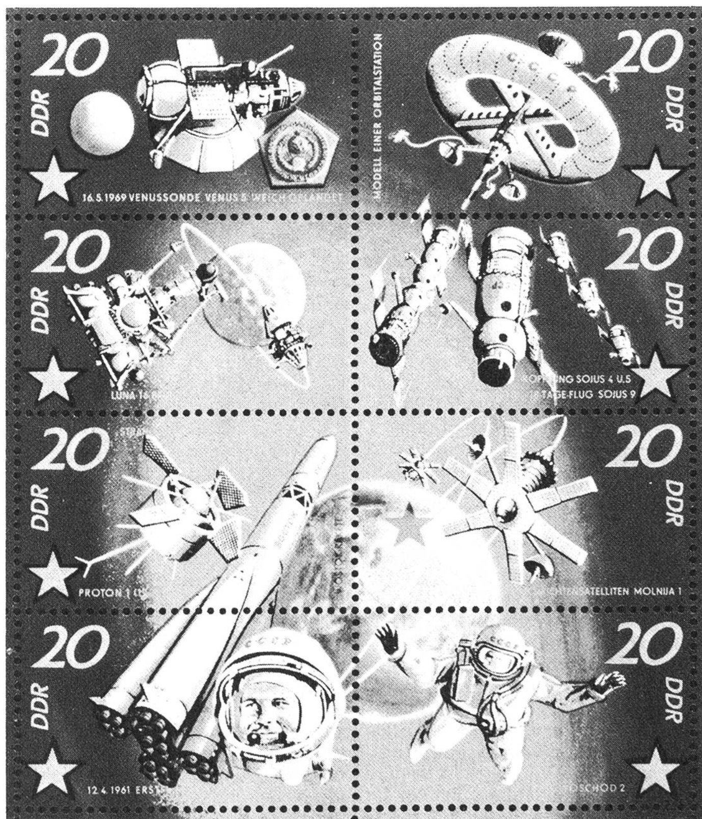
Deutsche Demokratische Republik 20, Sowjetische Weltraumerfolge