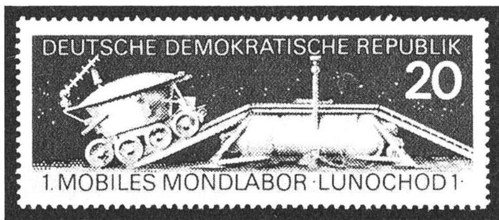
Deutsche Demokratische Republik 20, 1. Mobiles Mondlabor-Lunochod 1