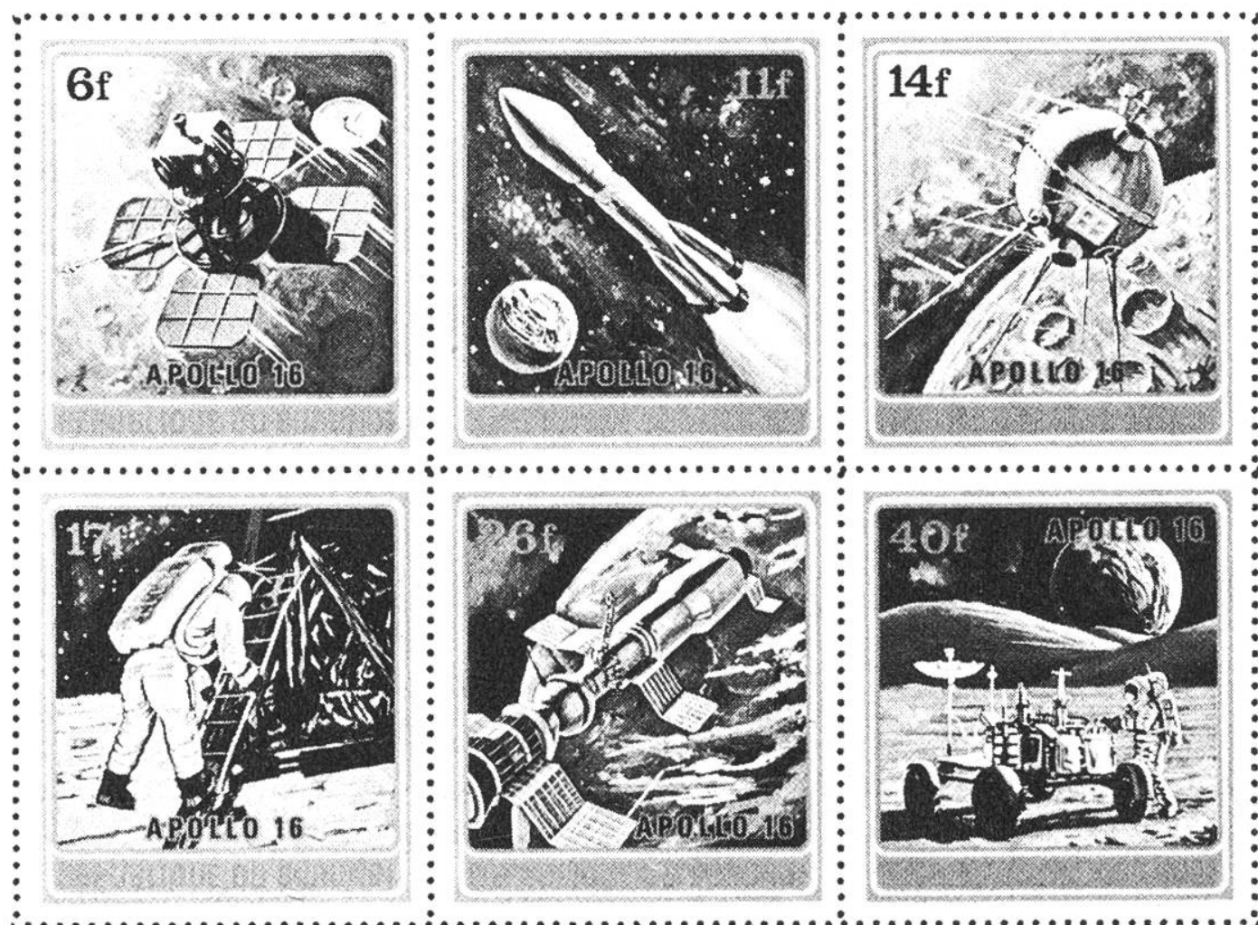
République du Burundi, Satz: Die Eroberung des Weltraumes, Apollo 16