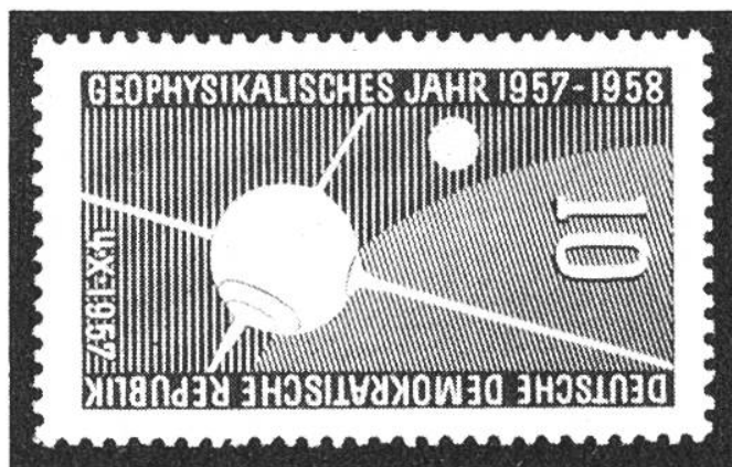
Deutsche Demokratische Republik 10, Geophysikalisches Jahr 1957-1958