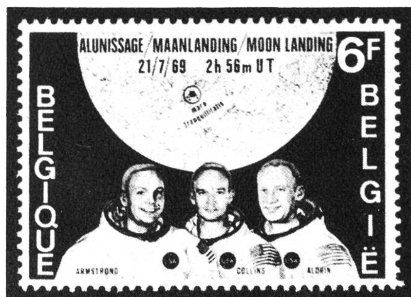
Belgique 6F, Mondlandung 21. 7. 69