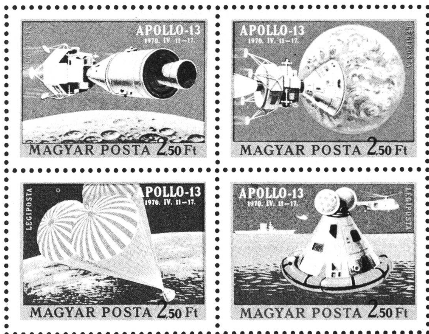
Ungarn, Magyar Posta 2,50 Ft, Apollo 13, 11.-17. April 1970