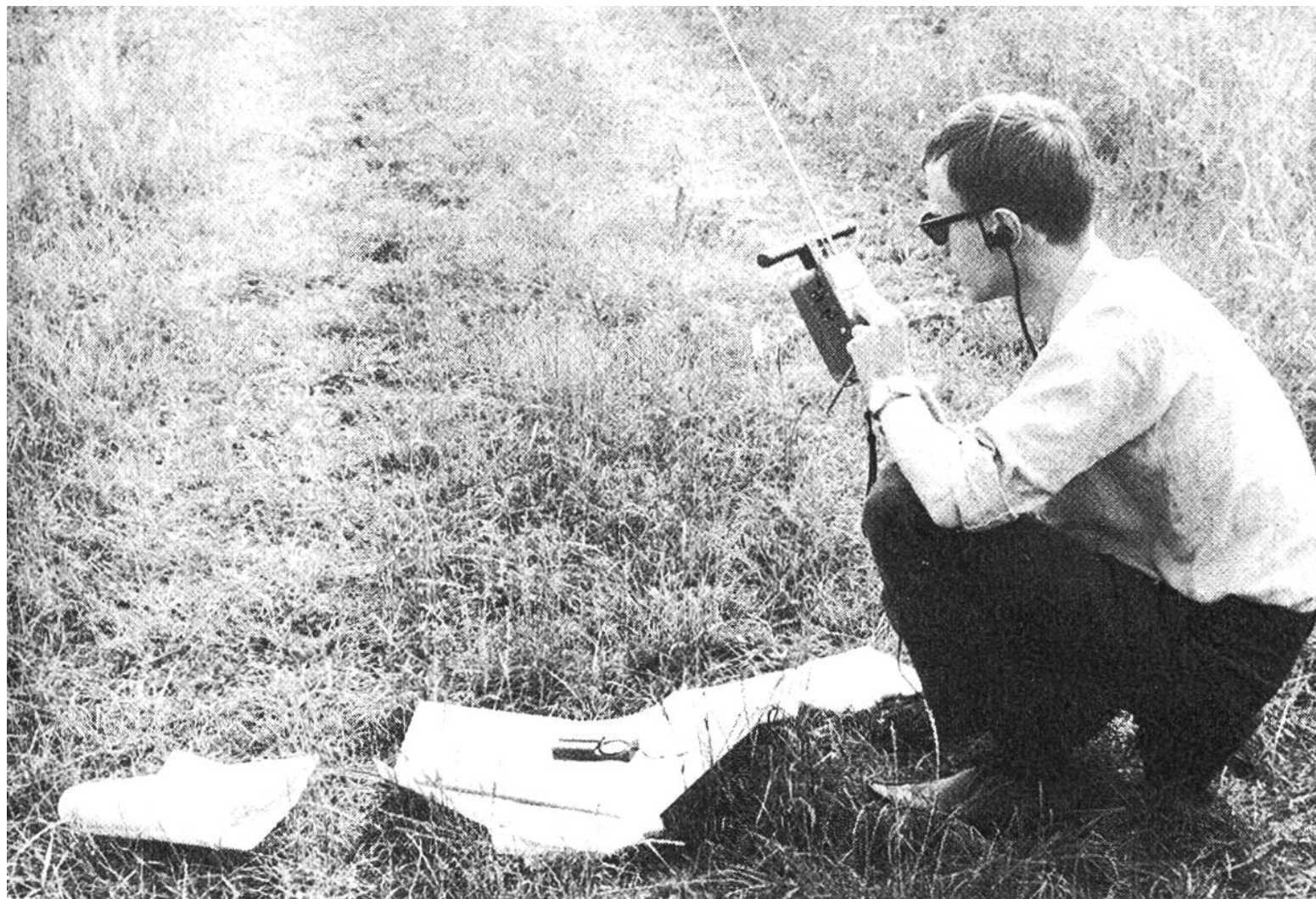
Das Aufsuchen eines versteckten Senders mittels eines Peilgerätes braucht viel Fingerspitzengefühl.