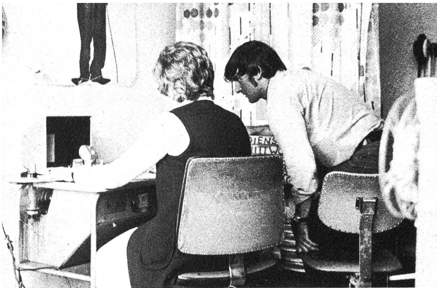
Zusammen mit dem Reporter oder dem Regisseur setzt die Cutterin an einem Schneidetisch den Film zusammen.

ren Missachtung vielleicht nur einem Fachmann bewusst auffiele, die aber selbst bei manchen Laien das Gefühl aufkommen liesse: Hier stimmt doch etwas nicht!