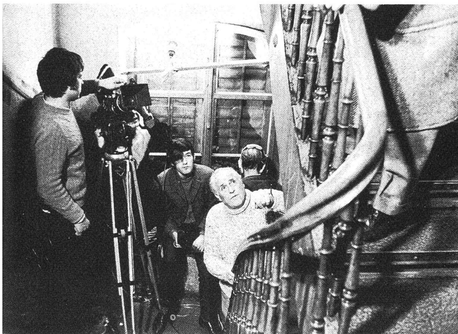
Der Regisseur (im weissen Pullover) gibt Schauspielern, Ton- und Kameralenten die letzten Anweisungen vor der Aufnahme.