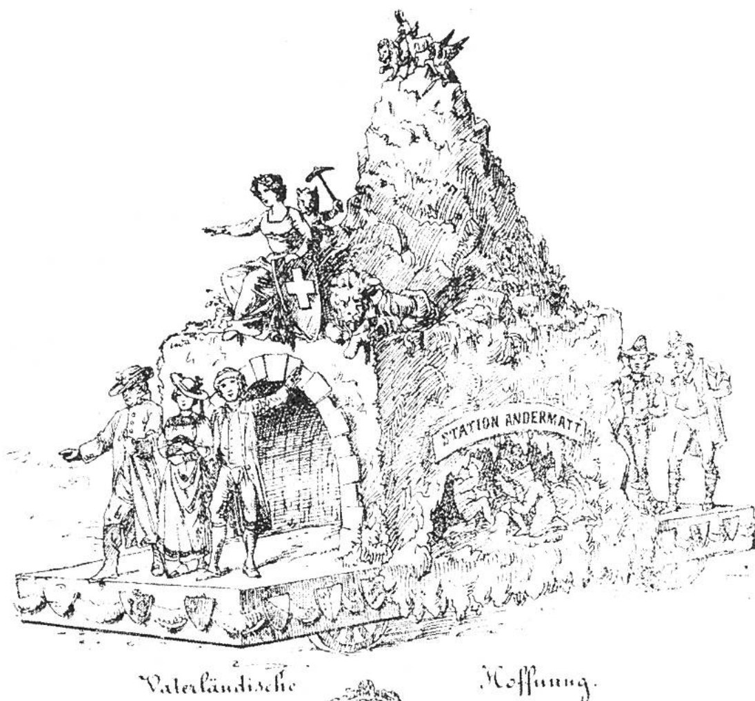
Gotthardtunnel, Sechseläuten, Zürich 1870.

nen Jahrzehnte in Erscheinung, und zwar in möglichst echter Kleidung aus der Zeit, in der sie lebten. Jeder empfand es als eine Ehre, durfte er Tell oder Winkelried darstellen. Als ein besonderes Privileg wurde es empfunden, die Helvetia zu verkörpern. – Da die Anzahl der Festlichkeiten wie eine ansteckende Seuche um sich griff, wurde das Volk übersättigt, man hatte bald einmal genug. – Von zwei Festlichkeiten soll nun noch berichtet werden: