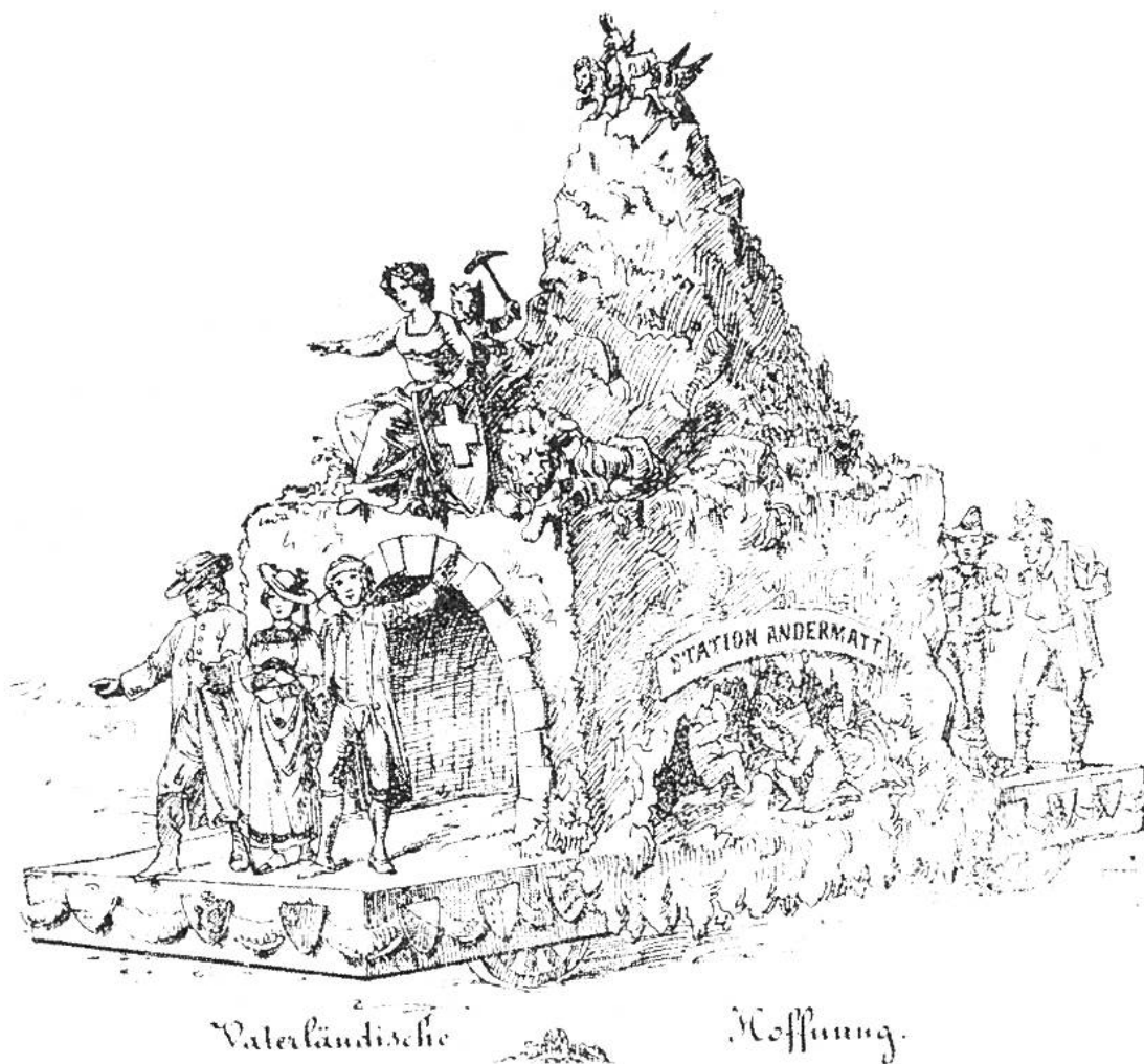
Gotthardtunnel, Sechseläuten, Zürich 1870.

nen Jahrzehnte in Erscheinung, und zwar in möglichst echter Kleidung aus der Zeit, in der sie lebten. Jeder empfand es als eine Ehre, durfte er Tell oder Winkelried darstellen. Als ein besonderes Privileg wurde es empfunden, die Helvetia zu verkörpern. – Da die Anzahl der Festlichkeiten wie eine ansteckende Seuche um sich griff, wurde das Volk übersättigt, man hatte bald einmal genug. – Von zwei Festlichkeiten soll nun noch berichtet werden: