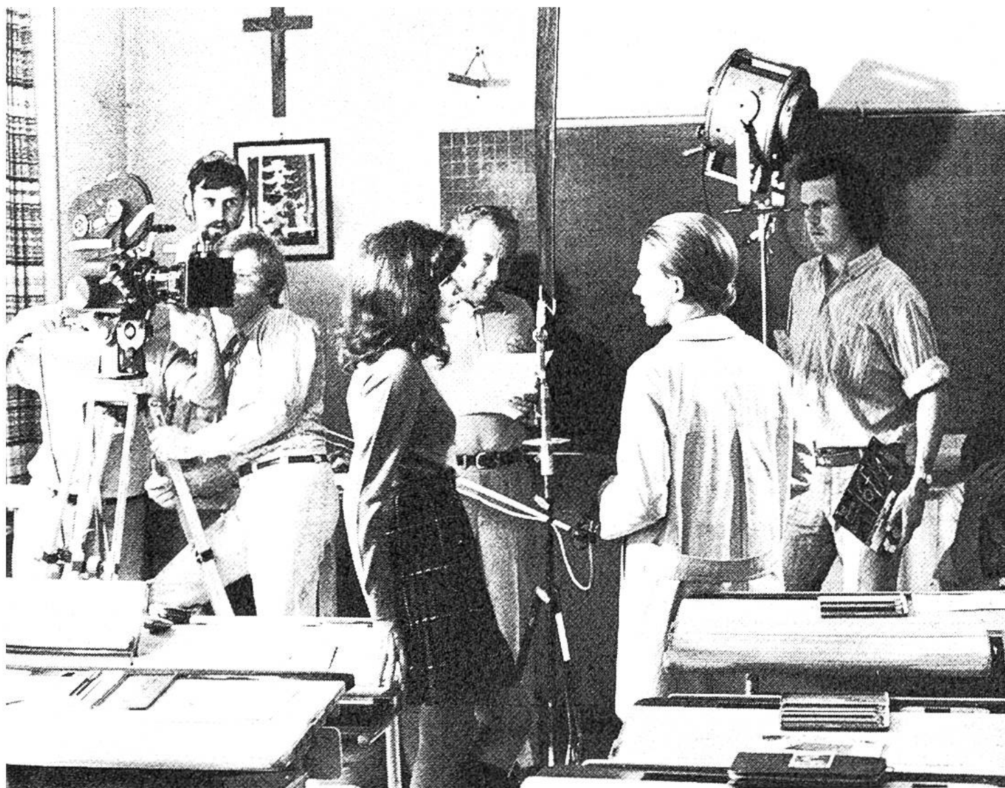
Spannung vor der Aufnahme. Noch einmal probieren die Schauspieler ihren Dialog.

leitet, der den Schauspielern Anweisungen gibt, wie und was sie wann zu sagen haben, und der den Kameralenten sagt, aus welcher Distanz sie die Schauspieler aufzunehmen haben.