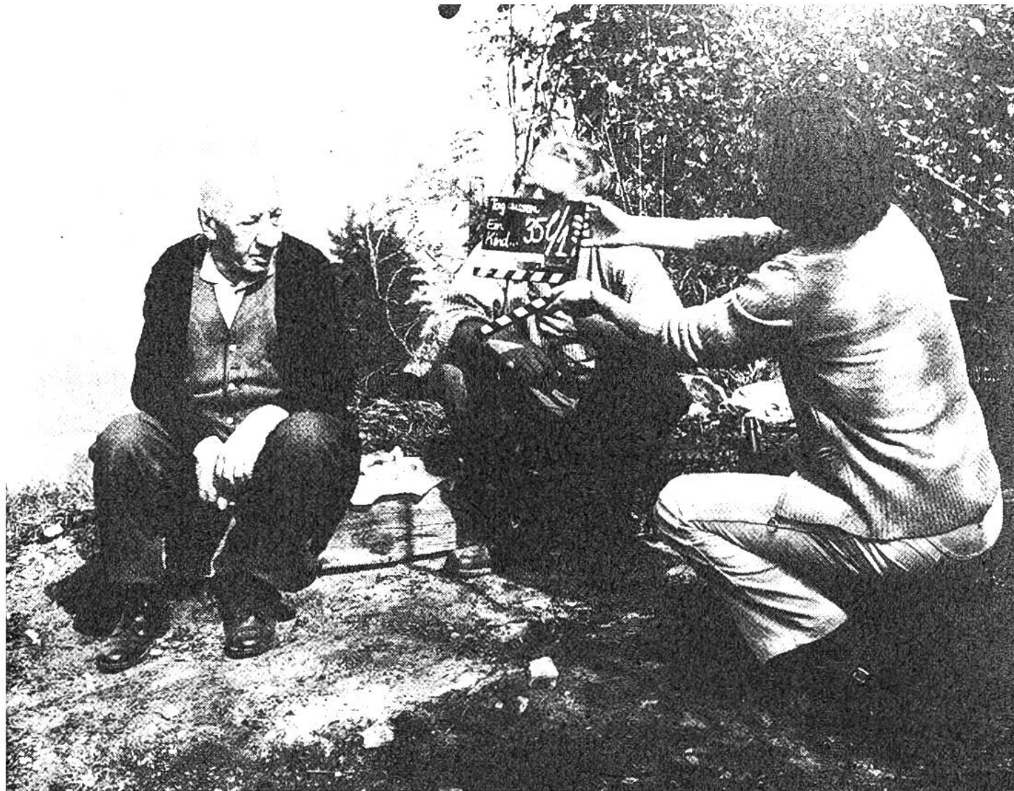
Der Schauspieler Heinrich Gretler bei einer Aussenaufnahme. Jede Szene wird mit der «Klappe» vom Aufnahmeleiter angesagt.

lich. Auf Grund des Drehbuches berechnet er die zu erwartenden Kosten. Da für jedes Fernsehspiel nur eine ganz bestimmte Summe zur Verfügung steht, müssen fast immer zunächst einmal gewaltige Abstriche gemacht, ja ganze Szenen weggelassen werden, damit die Kosten das Budget nicht überschreiten.