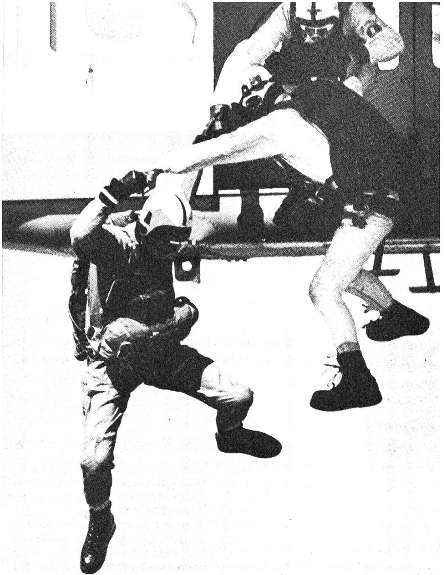
«Ausstieg» einer Dreiergruppe, die dann im freien Fall ein Figurenprogramm absolvieren wird.