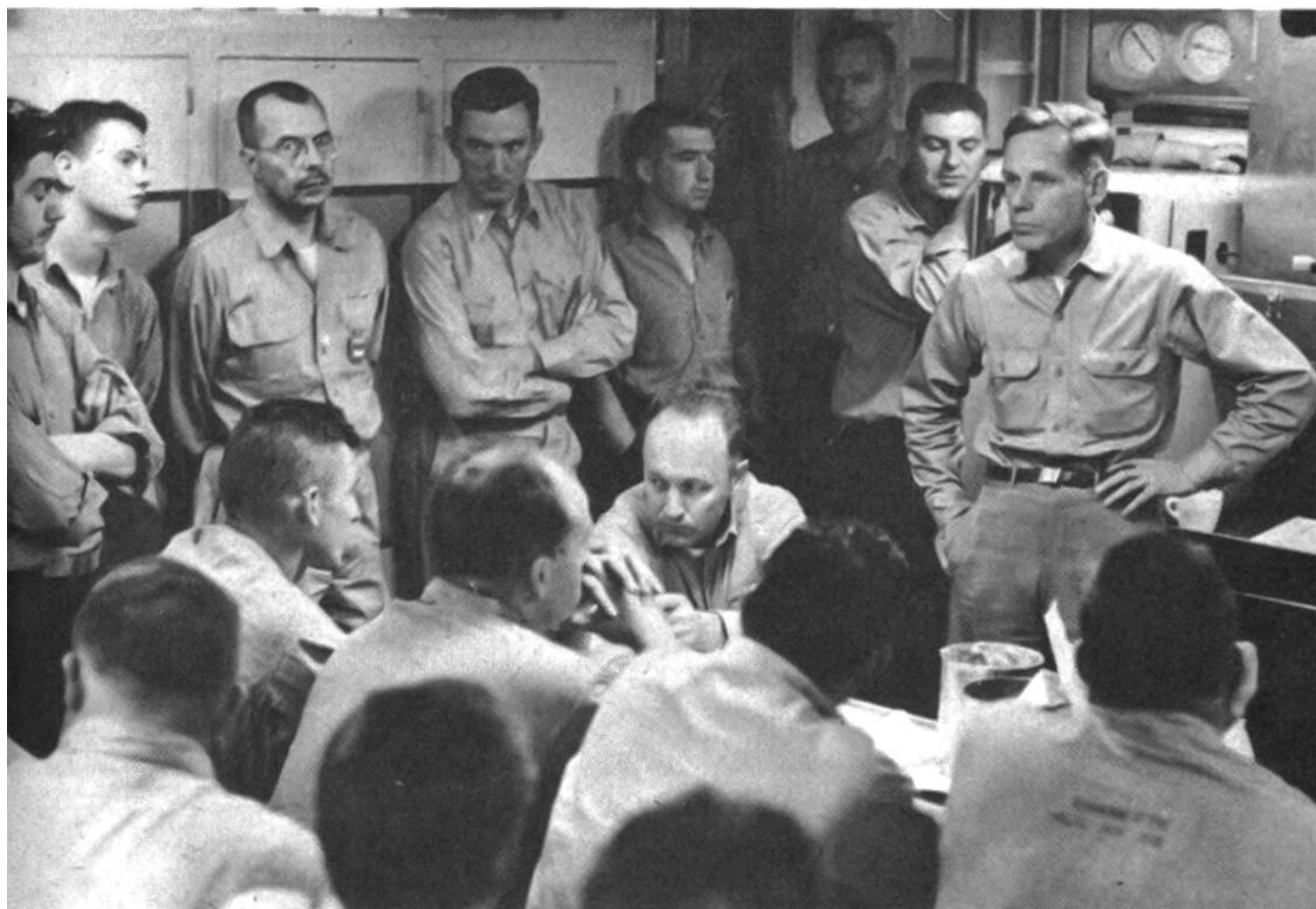
Die Offiziere des amerikanischen Atom-Unterseebootes «Nautilus» in einem Aufenthaltsraum bei der Diskussion von wissenschaftlichen Fragen.

Wassersystem energiereichen Dampf zu erzeugen. Dieser setzt die Schrauben in Bewegung, destilliert Seewasser zur Gewinnung von Trinkwasser und erzeugt elektrischen Strom, der nebenbei gewöhnliches Wasser in Sauer- und Wasserstoff aufspaltet. So ausgerüstet, stellt ein Atom-Unterseeboot eine sich selbst versorgende Einheit dar, die beliebig lange unter Wasser sein kann und nur kleine Mengen