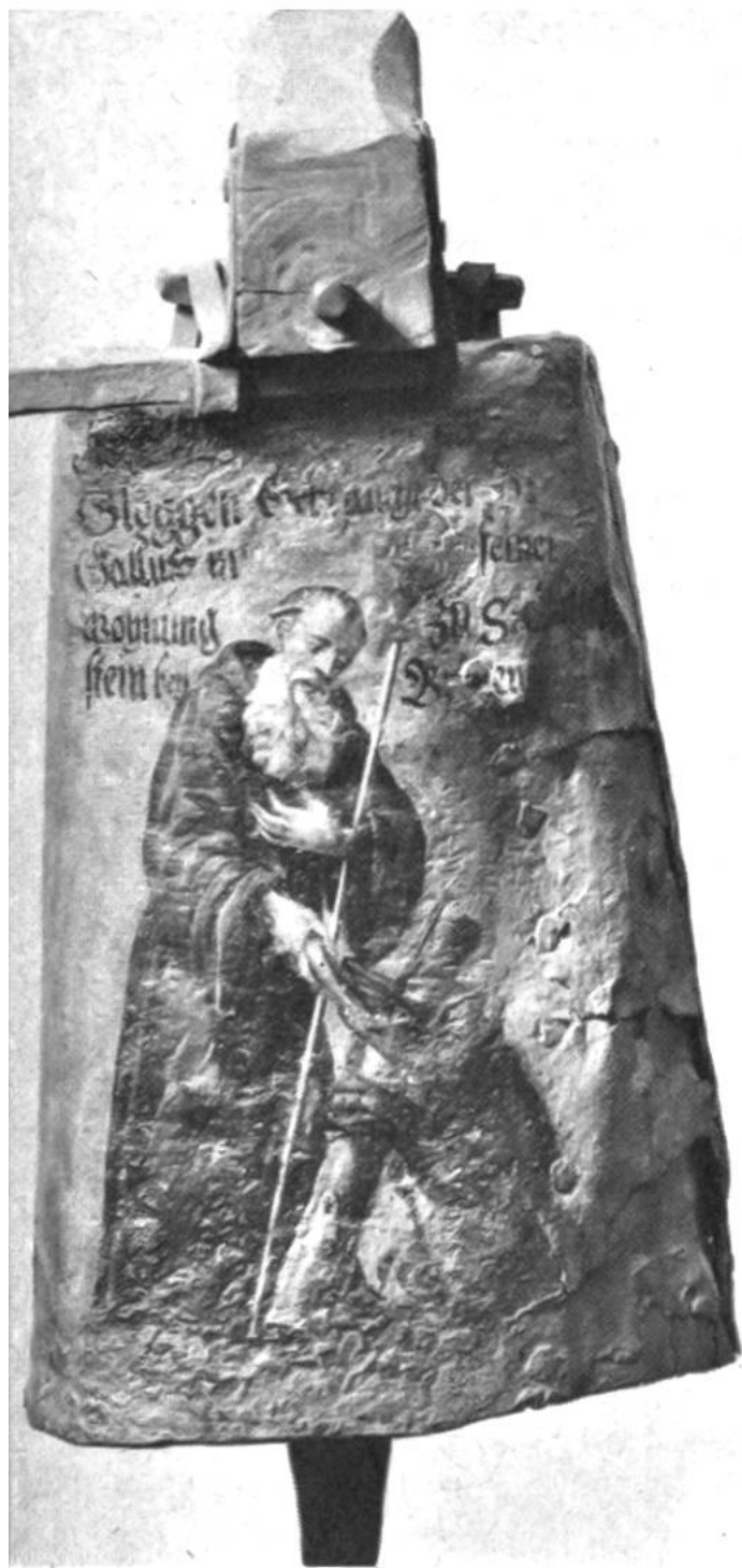
Sogenannte Gallus-Glocke in St. Gallen; irische Eisenblech-glocke aus dem 7. Jahrhundert mit barockem Bild des Gallus.

brief kehrt Gallus heim. Bald darauf wird der Einsiedler auf den Bischofsstuhl von Konstanz berufen. Gallus aber lehnt ab, da er von seinem Abt Kolumban