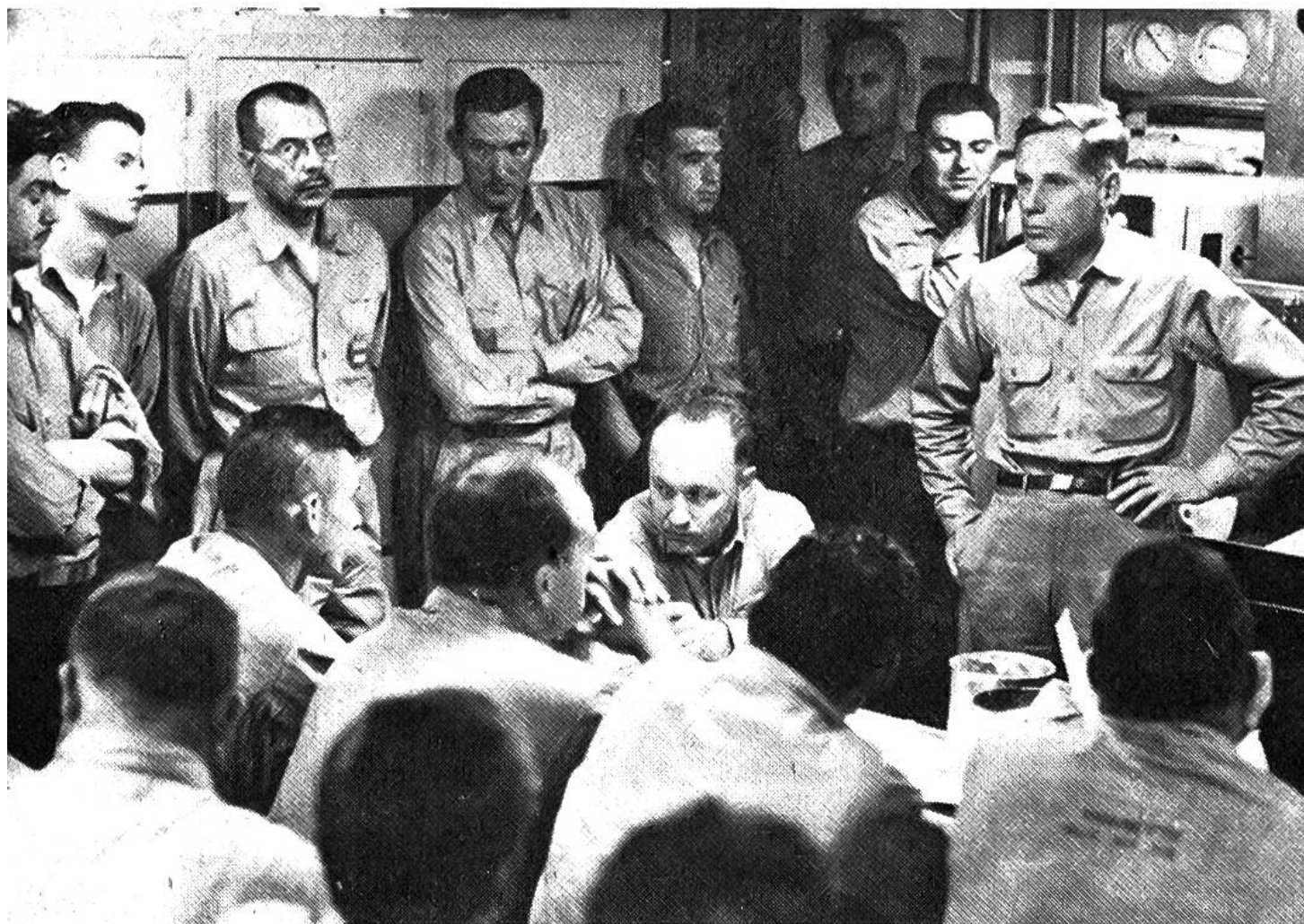
Die Offiziere des amerikanischen Atom-Unterseebootes «Nautilus» in einem Aufenthaltsraum bei der Diskussion von wissenschaftlichen Fragen.

Wassersystem energiereichen Dampf zu erzeugen. Dieser setzt die Schrauben in Bewegung, destilliert Seewasser zur Gewinnung von Trinkwasser und erzeugt elektrischen Strom, der nebenbei gewöhnliches Wasser in Sauer- und Wasserstoff aufspaltet. So ausgerüstet, stellt ein Atom-Unterseeboot eine sich selbst versorgende Einheit dar, die beliebig lange unter Wasser sein kann und nur kleine Mengen