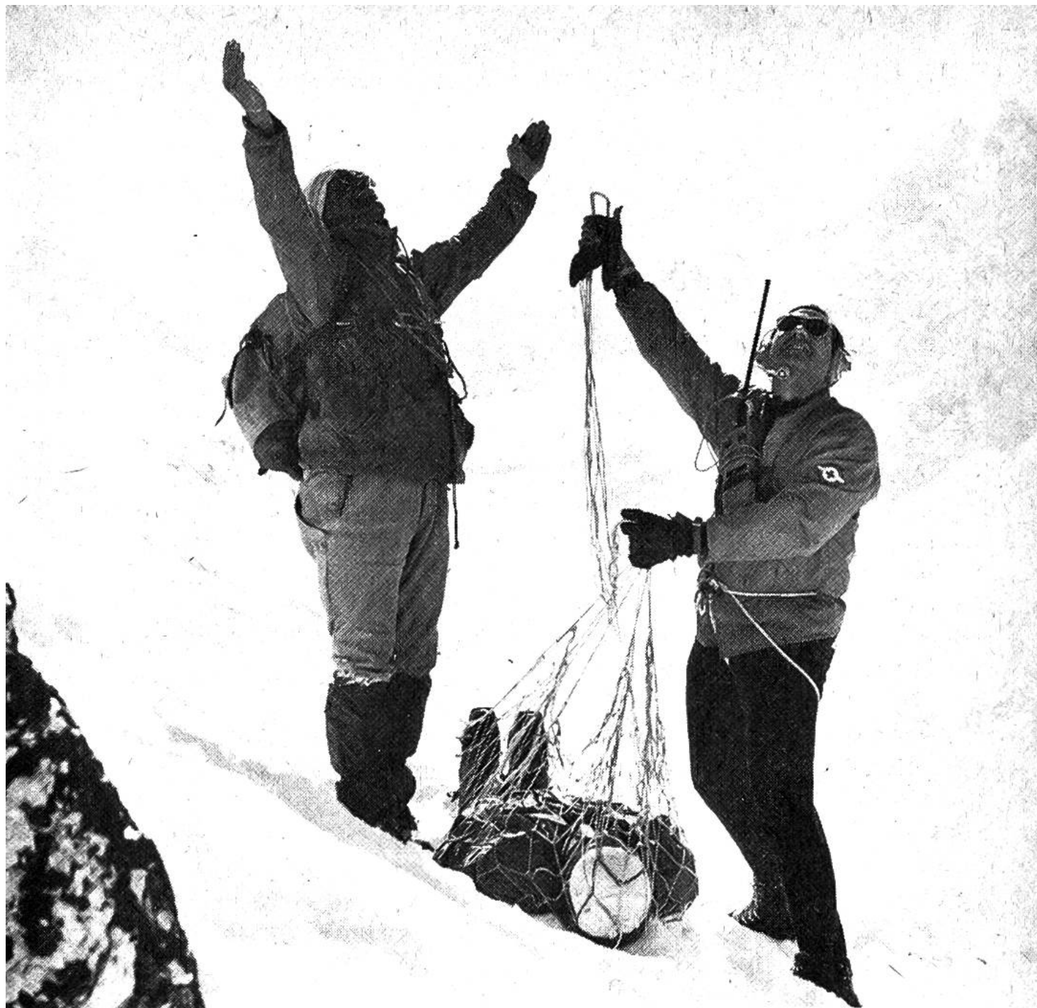
Mittels Funkgerät ruft der Flughelfer den Helikopterpiloten an die Unfallstelle, zum Abtransport des Verletzten.

Gletscherlandetechnik mit Ski- flugzeugen auf. Nachdem 1957 der erste Helikopter für alpine Rettungszwecke eingesetzt wor- den war, liessen sich auch Ret- tungen durchführen, die mit Flä- chenflugzeugen nicht mehr mög- lich waren. Man konnte mit einem Helikopter auf relativ klei-