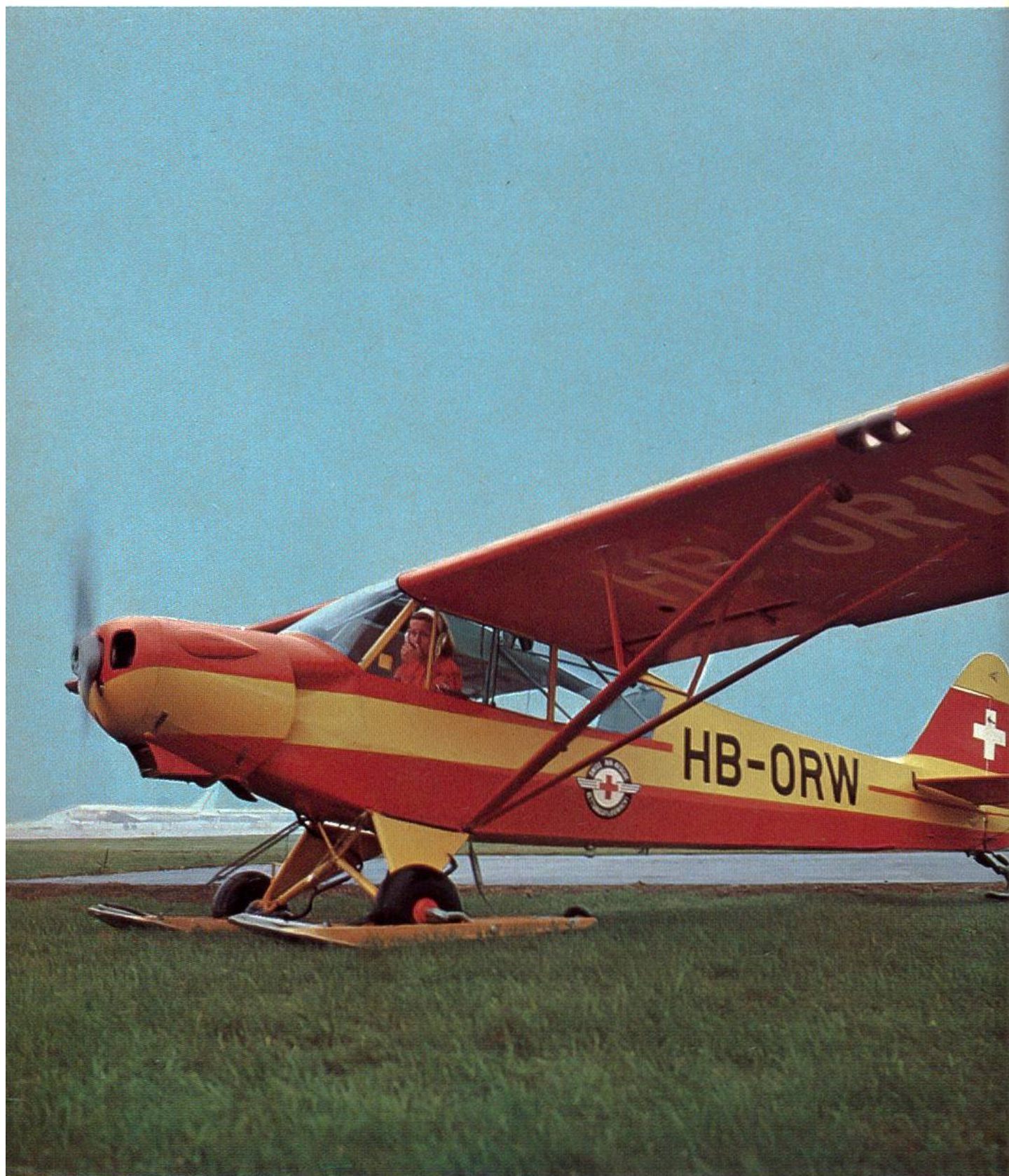
Piper PA-18, Super Cub, zweisitziges Gletscherflugzeug mit Skis.