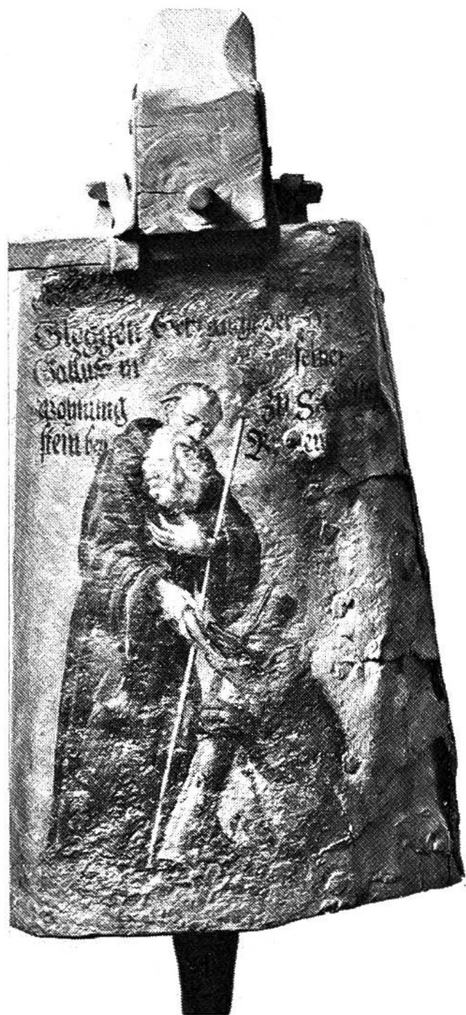
Sogenannte Gallus-Glocke in St. Gallen; irische Eisenblech-glocke aus dem 7. Jahrhundert mit barockem Bild des Gallus.

brief kehrt Gallus heim. Bald darauf wird der Einsiedler auf den Bischofsstuhl von Konstanz berufen. Gallus aber lehnt ab, da er von seinem Abt Kolumban