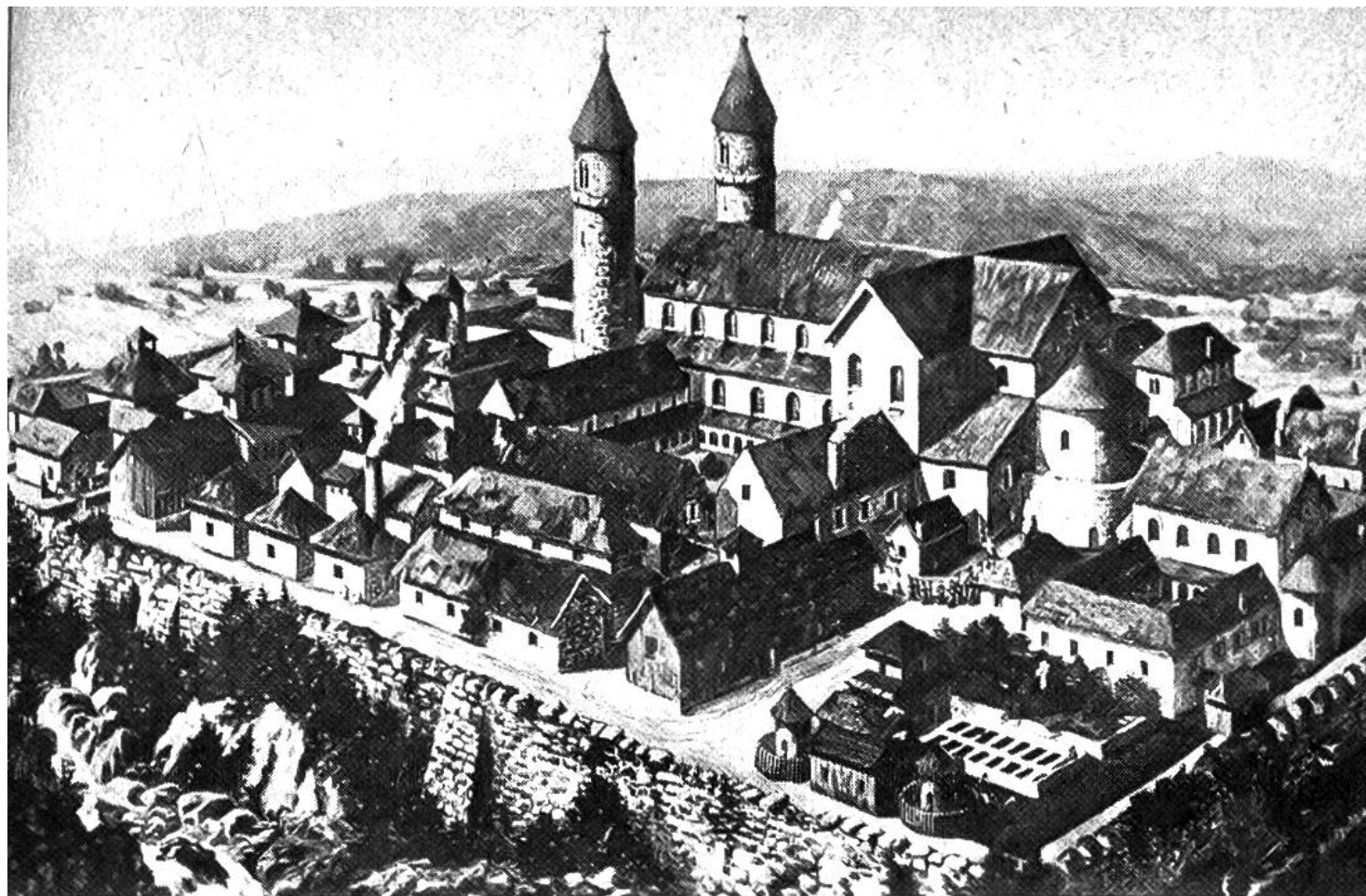
Kloster St. Gallen im 9. Jahrhundert, Rekonstruktion nach dem Klosterplan von 820.