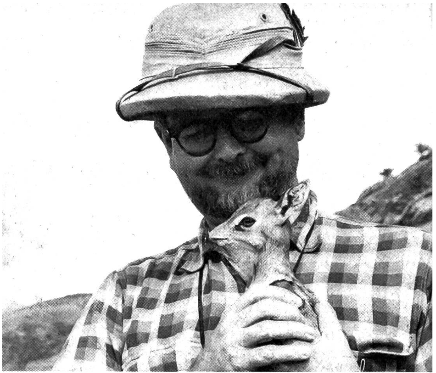
Der Verfasser mit einer jungen Dikdik-Antilope

In meinen Büchern, Artikeln und Vorträgen bin ich darauf ausgegangen, das wahre Leben der afrikanischen Tiere zu schildern. Ebenso sehr ist es mir aber immer darum zu tun, zur Erhaltung dieser Tierwelt aufzurufen. Die Löwen, Leoparden, Nashörner, Elefanten, Giraffen und alle die anderen Grosstiere sind einzigartige Naturdenkmäler und des Schutzes ebenso würdig wie die Denkmäler menschlichen Schaffens. Sie bedürfen unseres Schutzes sogar noch mehr: Was Menschenhand geformt hat, kann nötigenfalls wieder nachgebildet werden. Eine ausgerotete Tierart aber ist für immer und ewig verloren! Von ganzem Herzen habe ich deshalb seinerzeit die Schaffung des «World Wildlife Fund» begrüsst.