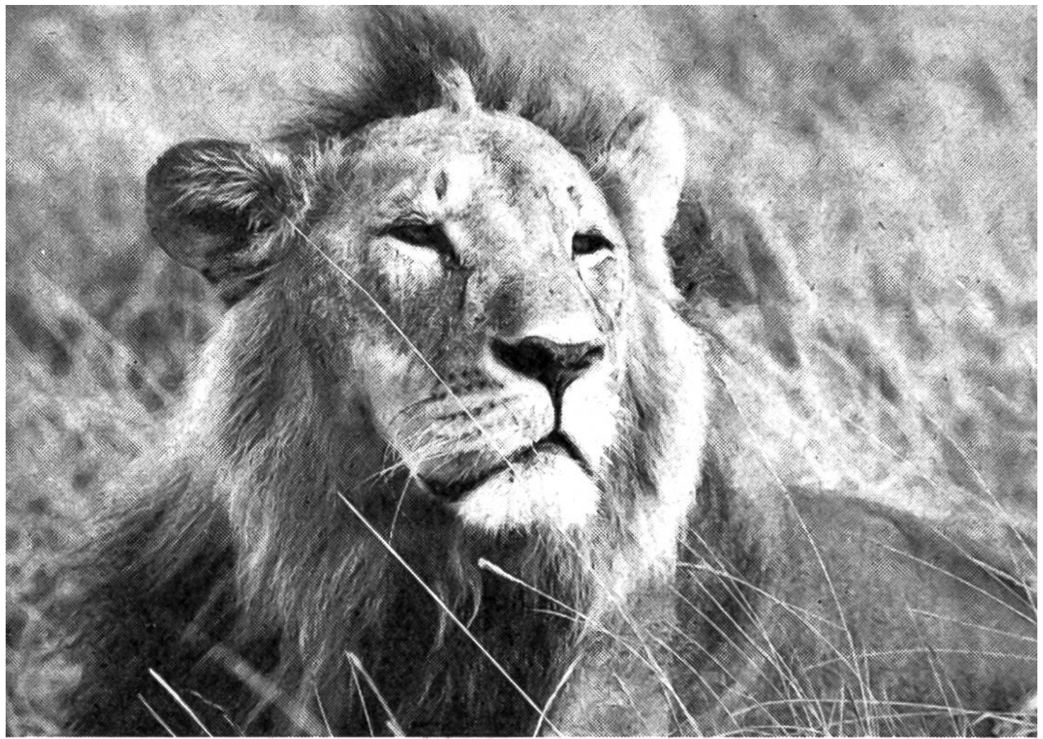
Junger Mähnenlöwe im Nairobi-Nationalpark

Elefanten oder Nashorn angegriffen – was durchaus vorkommen kann –, so drückt er eben auf den Starter und fährt schleunigst weg. Es ist etwas ganz anderes, so einem erbosten Riesen zu Fuss gegenüberzustehen. Ich habe es erlebt und betrachte es heute noch als ein Wunder, dass ich damals nicht von einer wütenden Elefantenkuh zertrampelt wurde.