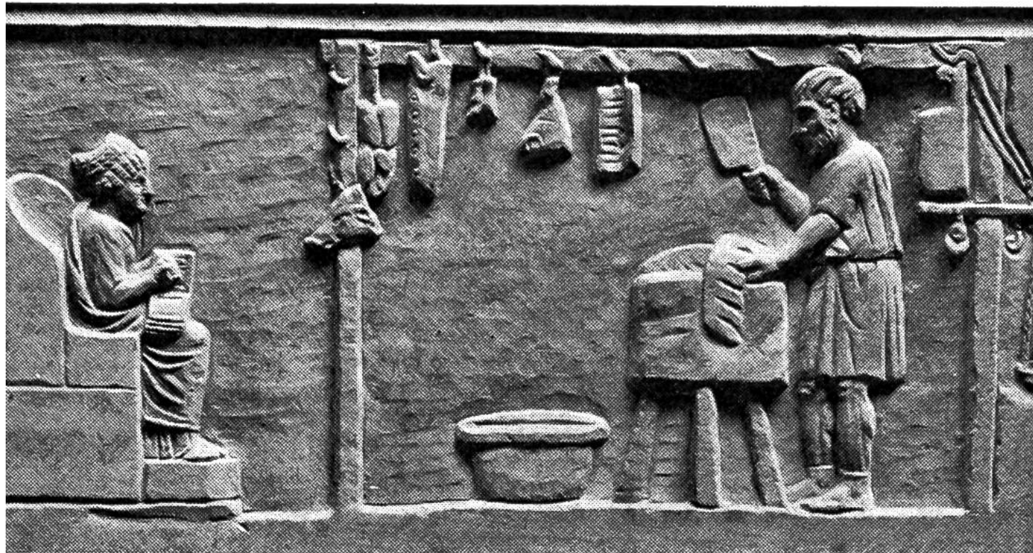
Laden für Schweinefleisch.

Stadt. Hier macht man Geschäfte, sucht Entspannung und Erholung, hier tauscht man Neuigkeiten aus, holt Nachrichten ein, treibt Politik und feiert Feste. Natürlich gehört ein Tempel zu diesem Stadtzentrum, das Capitol. Eine pompöse Freitreppe führt zum Heiligtum mit den Standbildern der Gottheiten Jupiter, Juno und Minerva. In Nebenstrassen finden sich Klubhäuser verschiedener Berufsgruppen. Zahlreich sind die Schenken und Gasthäuser, die den im Hafen, in Läden und Werkstätten Beschäftigten, den Seeleuten und den Reisenden zur Verfügung stehen. An verschiedenen Stellen der Stadt erheben sich auch Thermen, öffentliche Bäder.