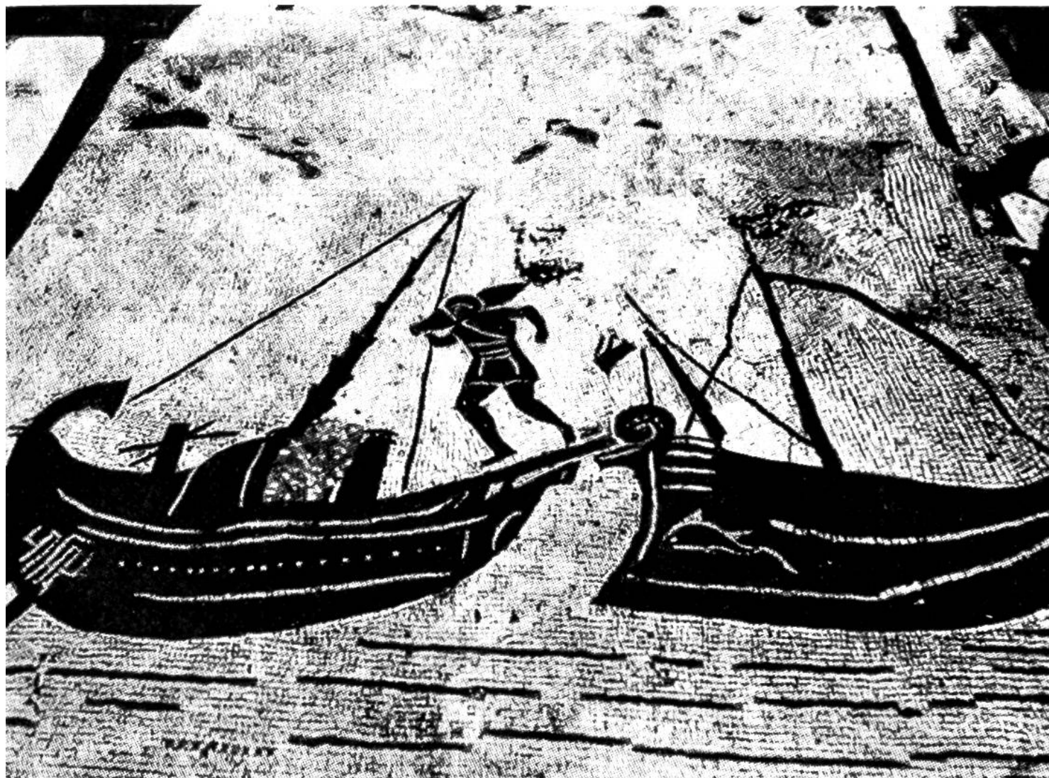
Firmenschild vom Platz der Korporationen: Verlad von Weinamphoren.

Hauptstadt Rom zur Aufgabe hat. Aber auch die Handelsrouten nach Sardinien, Korsika und Südgallien sind stark befahren. Alexandrien gehört ebenfalls zu den Handelspartnern. Verschiedene Mosaikbilder stellen Seeschiffe dar, teilweise abgetakelt vor Anker liegend, wobei sie Fracht aufnehmen oder abgeben, teilweise in voller Fahrt mit grossem Segel am Hauptmast und kleinerem Sturm- oder Treibsegel am schrägen Vormast.