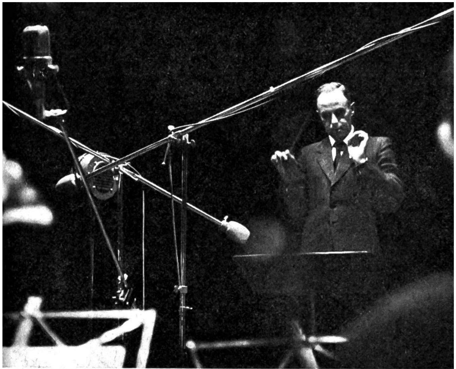
Musikaufnahme im Studio.

dessen Ende befand sich eine Membrane (gespanntes Häutchen) in Verbindung mit einer Nadel, welche auf einer sich drehenden Walze auflag, die von einer Stanniolfolie umspannt war. Die Luftschwingungen beim Sprechen versetzten die Membrane und die Nadel in Auf- und Ab-Bewegungen, wodurch eine verschieden tiefe Rille in die Folie eingeritzt wurde. Damit war der Schall gespeichert. Durch Umkehren des Vorgangs, also beim Drehen der Walze, wobei die Nadel durch die Rille in Schwingungen versetzt wurde, konnten die Töne über die Membrane und den Trichter wieder hörbar gemacht werden.