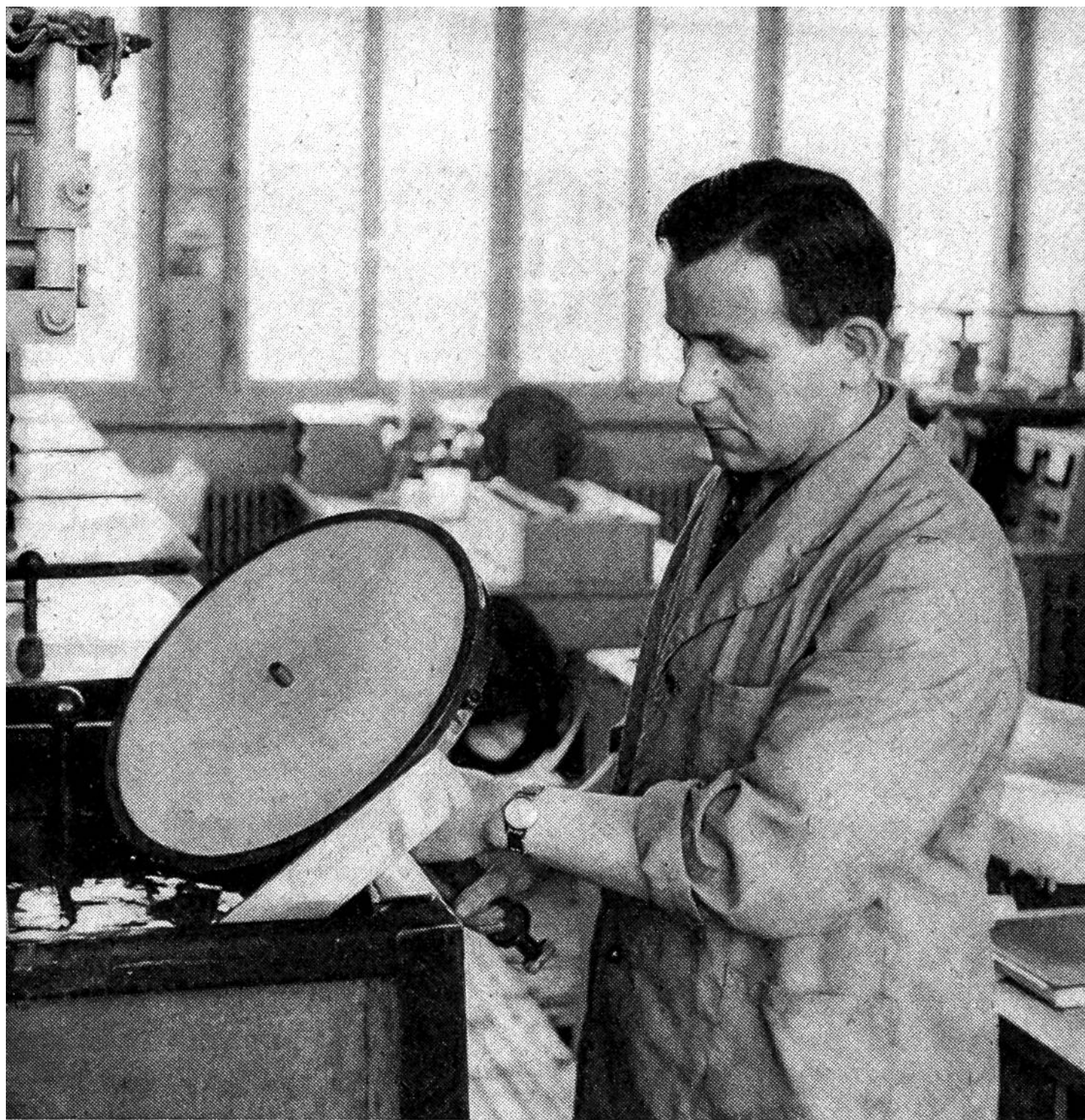
Eine «Vatermatrize» im galvanischen Bad.

matrize» oder kurz der «Vater» vor. Er ist gewissermassen ein «Spiegelbild» der Lackfolie: während die Rillen dort vertieft waren, treten sie hier als Erhebungen heraus.