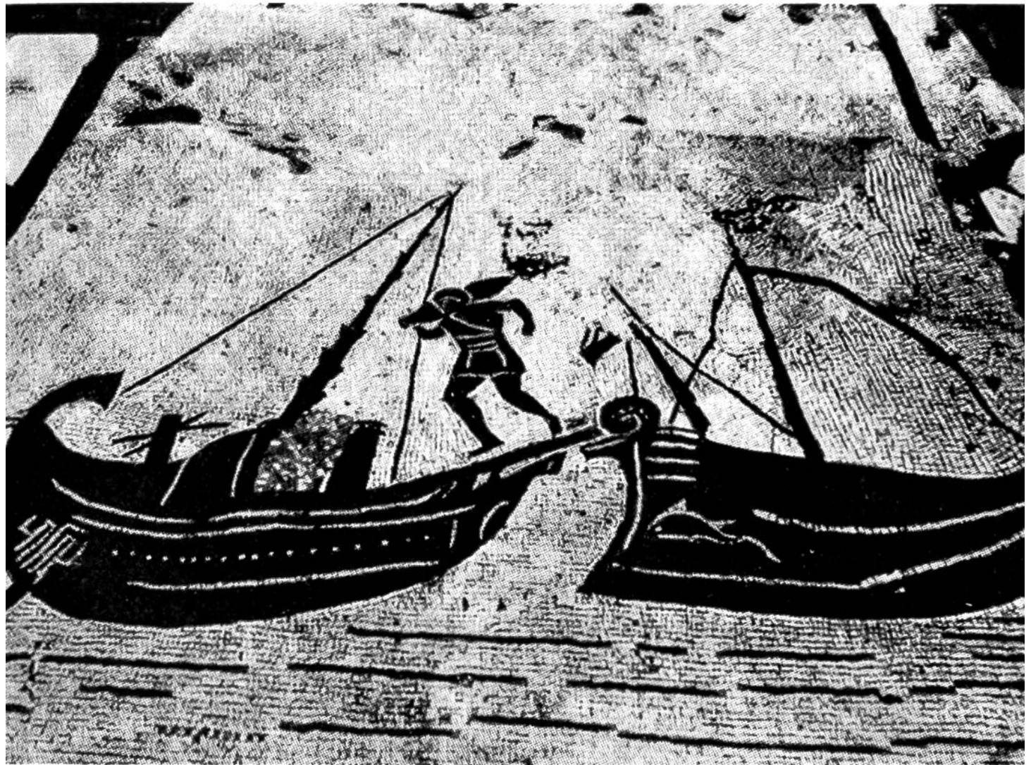
Firmenschild vom Platz der Korporationen: Verlad von Weinamphoren.

Hauptstadt Rom zur Aufgabe hat. Aber auch die Handelsrouten nach Sardinien, Korsika und Südgallien sind stark befahren. Alexandrien gehört ebenfalls zu den Handelspartnern. Verschiedene Mosaikbilder stellen Seeschiffe dar, teilweise abgetakelt vor Anker liegend, wobei sie Fracht aufnehmen oder abgeben, teilweise in voller Fahrt mit grossem Segel am Hauptmast und kleinerem Sturm- oder Treibsegel am schrägen Vormast.