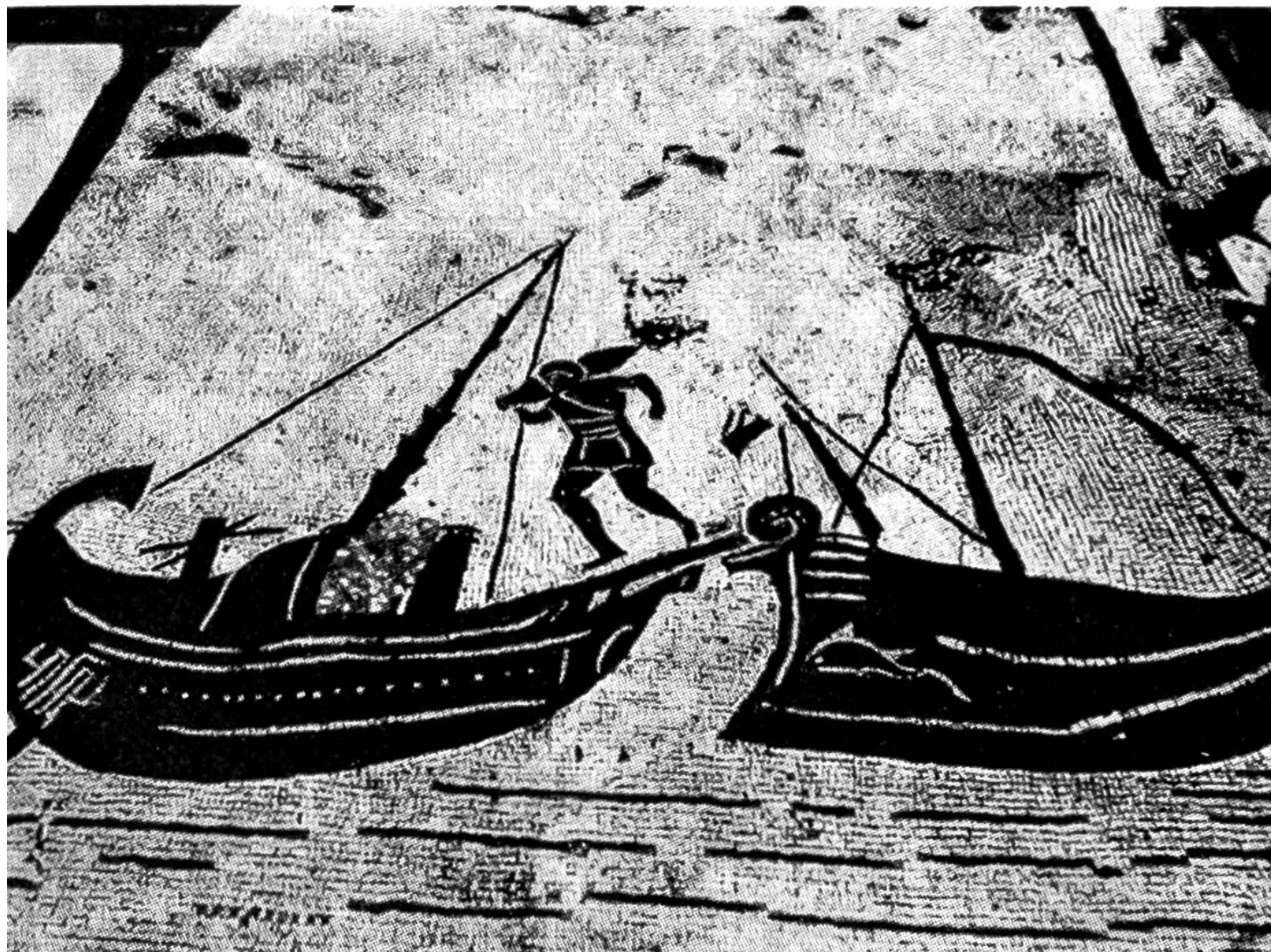
Firmenschild vom Platz der Korporationen: Verlad von Weinamphoren.

Hauptstadt Rom zur Aufgabe hat. Aber auch die Handelsrouten nach Sardinien, Korsika und Südgalien sind stark befahren. Alexandrien gehört ebenfalls zu den Handelspartnern. Verschiedene Mosaikbilder stellen Seeschiffe dar, teilweise abgetakelt vor Anker liegend, wobei sie Fracht aufnehmen oder abgeben, teilweise in voller Fahrt mit grossem Segel am Hauptmast und kleinerem Sturm- oder Treibsegel am schrägen Vormast.