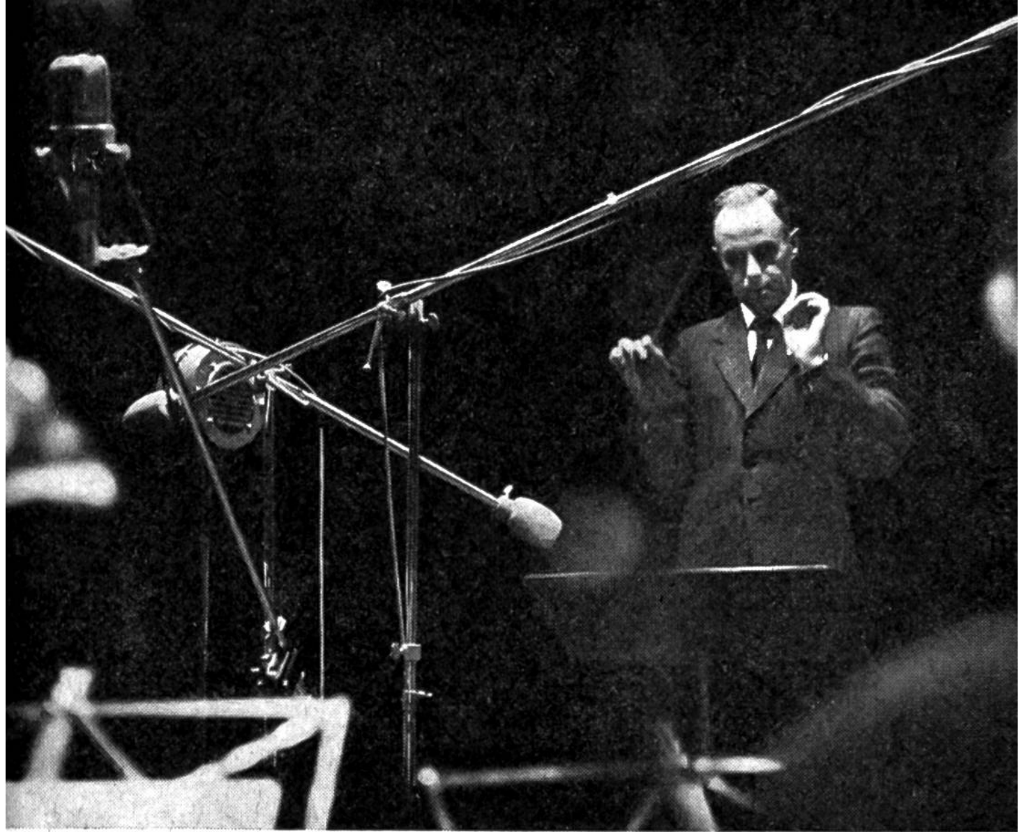
Musikaufnahme im Studio.

dessen Ende befand sich eine Membrane (gespanntes Häutchen) in Verbindung mit einer Nadel, welche auf einer sich drehenden Walze auflag, die von einer Stanniolfolie umspannt war. Die Luftschwingungen beim Sprechen versetzten die Membrane und die Nadel in Auf- und Ab-Bewegungen, wodurch eine verschieden tiefe Rille in die Folie eingeritzt wurde. Damit war der Schall gespeichert. Durch Umkehren des Vorgangs, also beim Drehen der Walze, wobei die Nadel durch die Rille in Schwingungen versetzt wurde, konnten die Töne über die Membrane und den Trichter wieder hörbar gemacht werden.