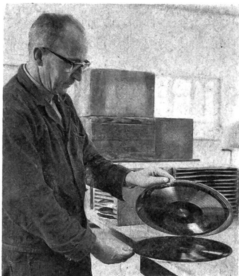
Trennung eines «Sohns» von einer «Mutter».

fältig auf reine Tonwiedergabe geprüft. Allfällige Fehlerstellen müssen von Hand mit feinsten Werkzeugen herausgesticht werden. Ist die «Mutter» in Ordnung, so wird in einem weiteren Galvanisiervorgang die eigentliche Pressmatrize namens «Sohn» hergestellt. Ihre «Rillen» sind wieder erhöht. Um seine Widerstandsfähigkeit beim Pressen zu verbessern – mit einem «Sohn» werden etwa 5000 Platten geprägt –, wird er noch verchromt. Dann stanzt man das Mittelloch heraus, wobei äusserste Genauigkeit nötig ist, da sonst die gepressten Platten nicht rund laufen würden und damit unbrauchbar wären.