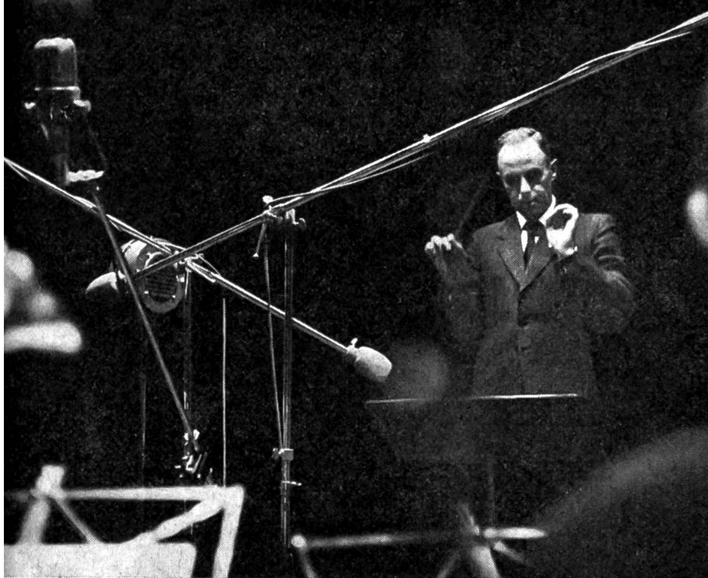
Musikaufnahme im Studio.

dessen Ende befand sich eine Membrane (gespanntes Häutchen) in Verbindung mit einer Nadel, welche auf einer sich drehenden Walze auflag, die von einer Stanniolfolie umspannt war. Die Luftschwingungen beim Sprechen versetzten die Membrane und die Nadel in Auf- und Ab-Bewegungen, wodurch eine verschieden tiefe Rille in die Folie eingeritzt wurde. Damit war der Schall gespeichert. Durch Umkehren des Vorgangs, also beim Drehen der Walze, wobei die Nadel durch die Rille in Schwingungen versetzt wurde, konnten die Töne über die Membrane und den Trichter wieder hörbar gemacht werden.