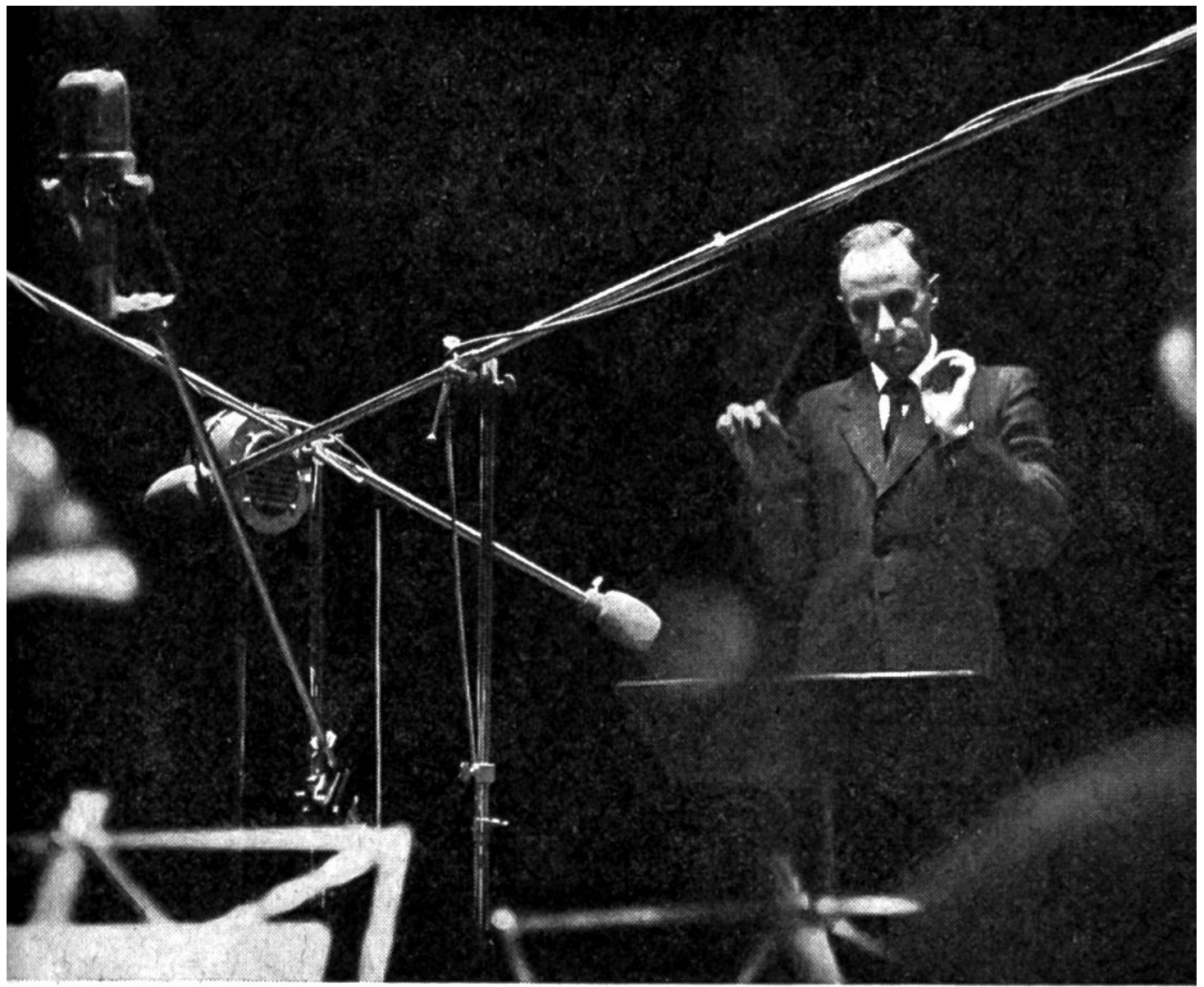
Musikaufnahme im Studio.

dessen Ende befand sich eine Membrane (gespanntes Häutchen) in Verbindung mit einer Nadel, welche auf einer sich drehenden Walze auflag, die von einer Stanniolfolie umspannt war. Die Luftschwingungen beim Sprechen versetzten die Membrane und die Nadel in Auf- und Ab-Bewegungen, wodurch eine verschieden tiefe Rille in die Folie eingeritzt wurde. Damit war der Schall gespeichert. Durch Umkehren des Vorgangs, also beim Drehen der Walze, wobei die Nadel durch die Rille in Schwingungen versetzt wurde, konnten die Töne über die Membrane und den Trichter wieder hörbar gemacht werden.