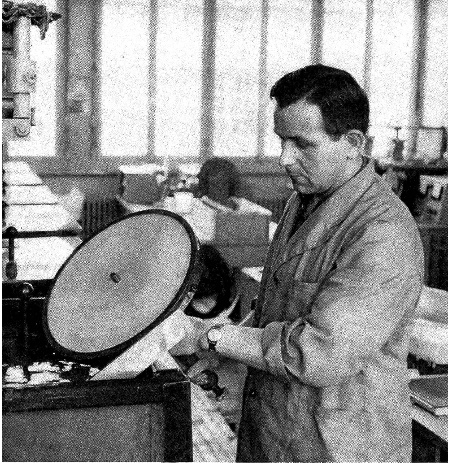
Eine «Vatermatrize» im galvanischen Bad.

matrize» oder kurz der «Vater» vor. Er ist gewissermassen ein «Spiegelbild» der Lackfolie: während die Rillen dort vertieft waren, treten sie hier als Erhebungen heraus.