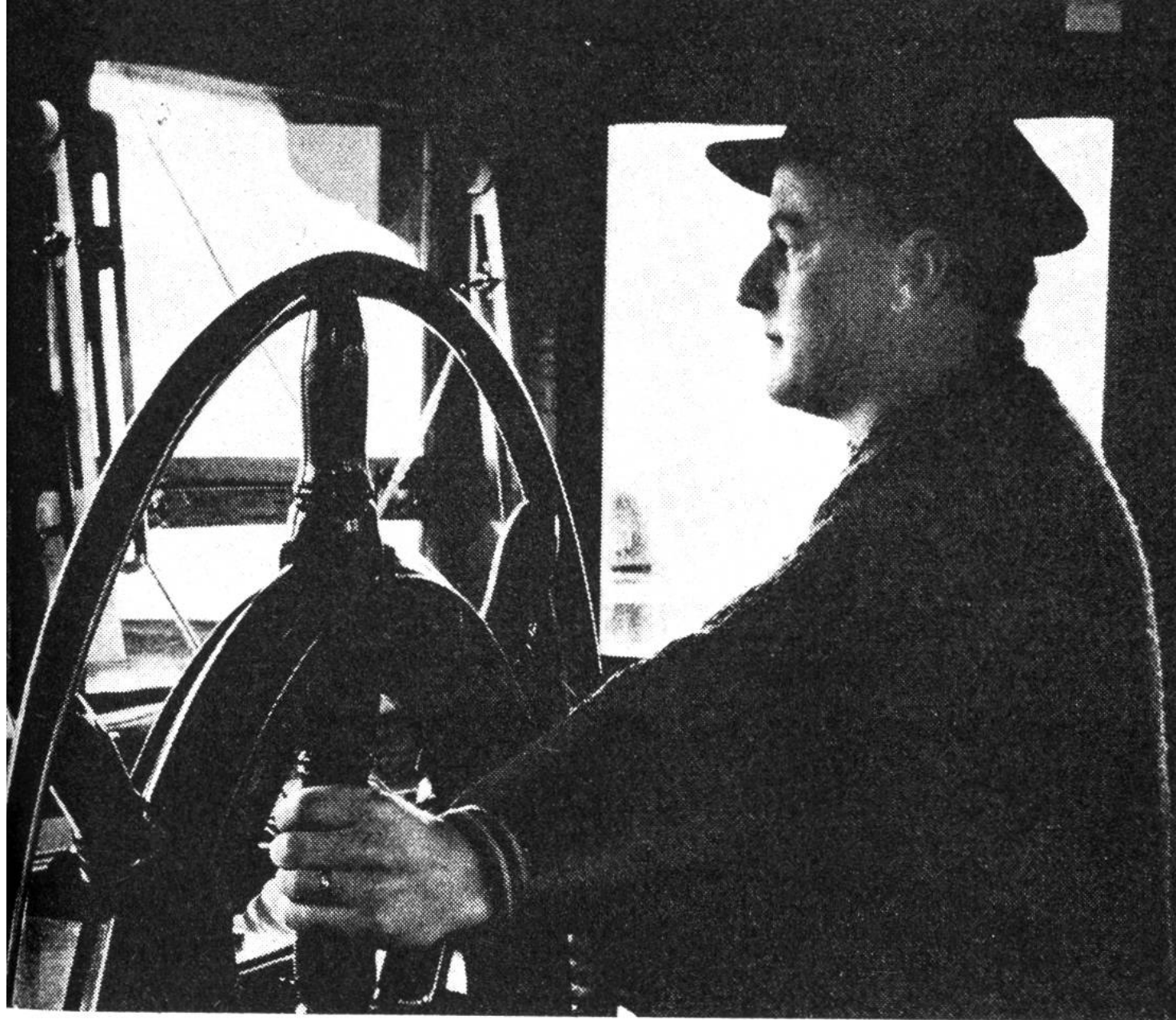
Schweizerischer Rheinschiffsführer am Steuerstuhl.

dass die Wasserstrasse nicht nur die leistungsfähigste, sondern auch die billigste Transportmöglichkeit bietet.