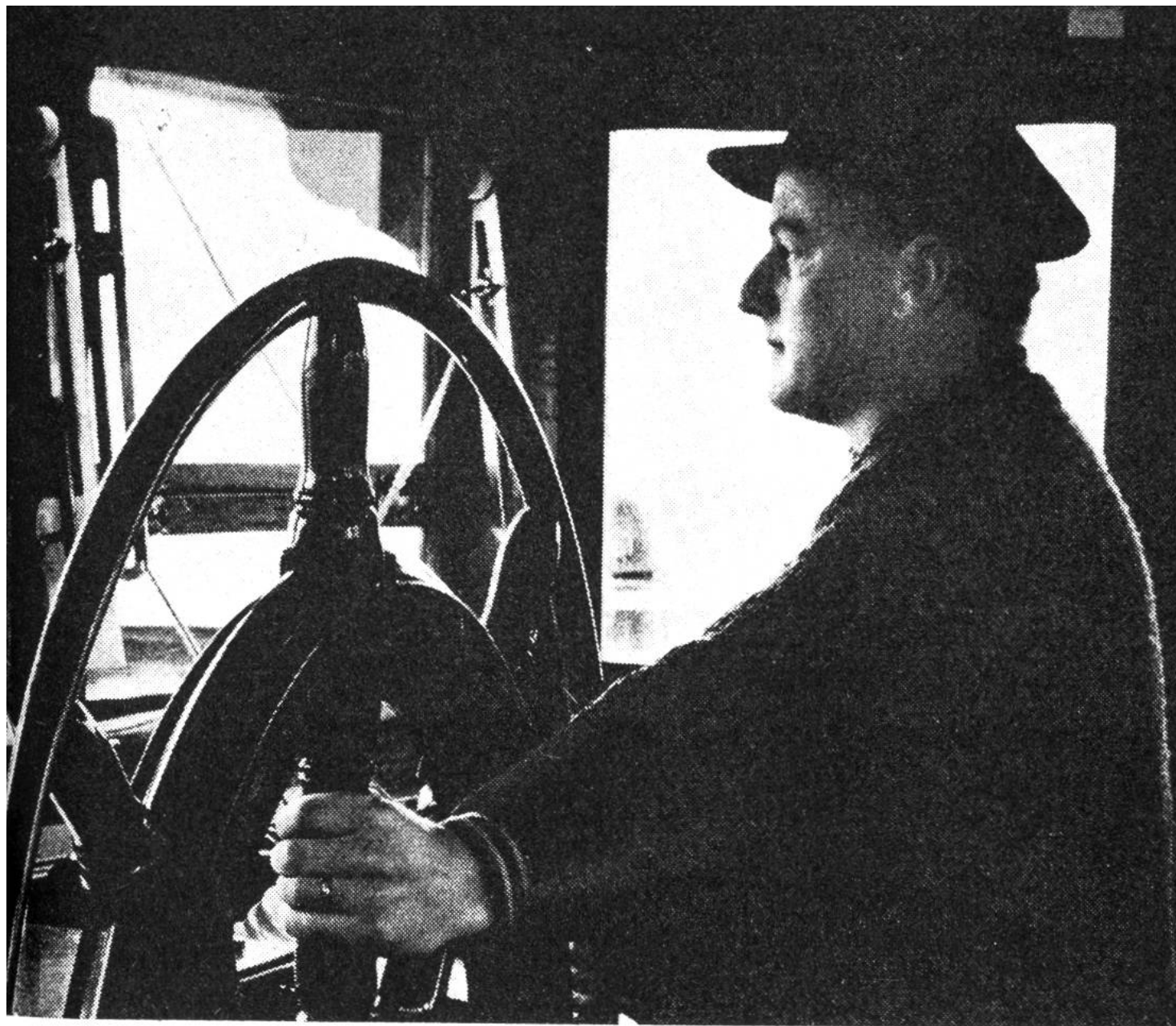
Schweizerischer Rheinschiffsführer am Steuerstuhl.

dass die Wasserstrasse nicht nur die leistungsfähigste, sondern auch die billigste Transportmöglichkeit bietet.