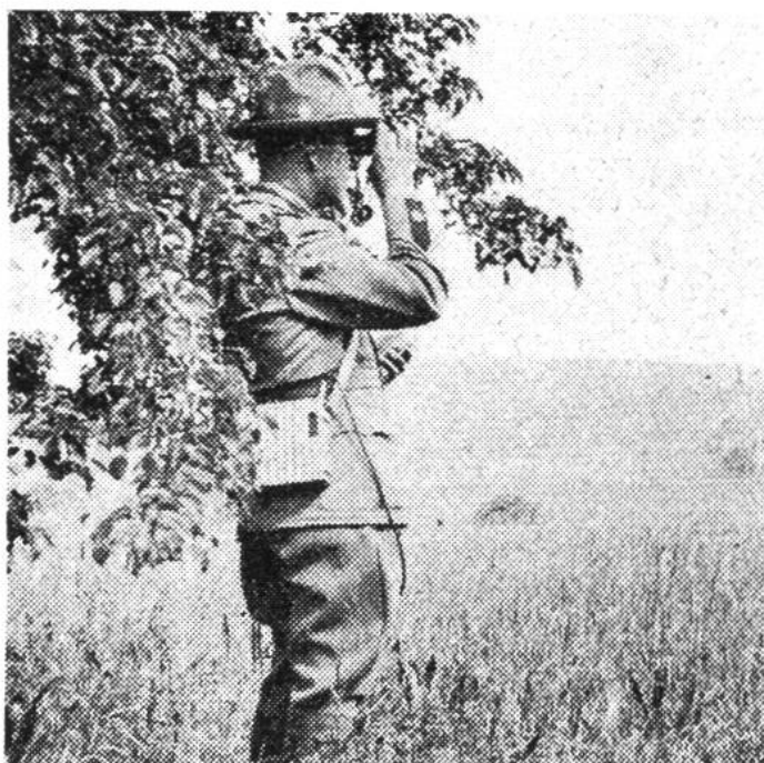
Grenzwächter mit Funkgerät