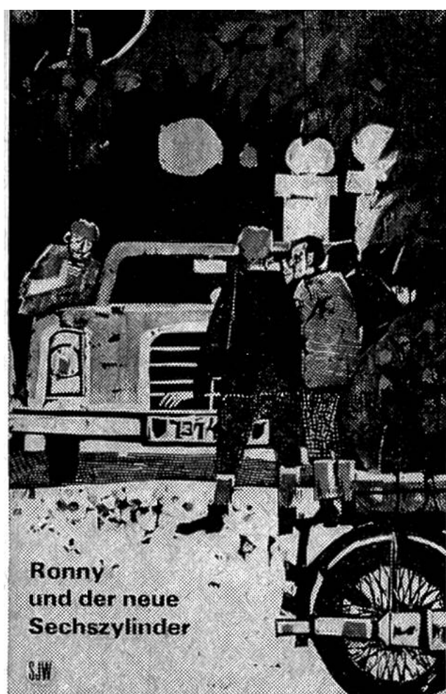
Ronny und der neue Sechszylinder