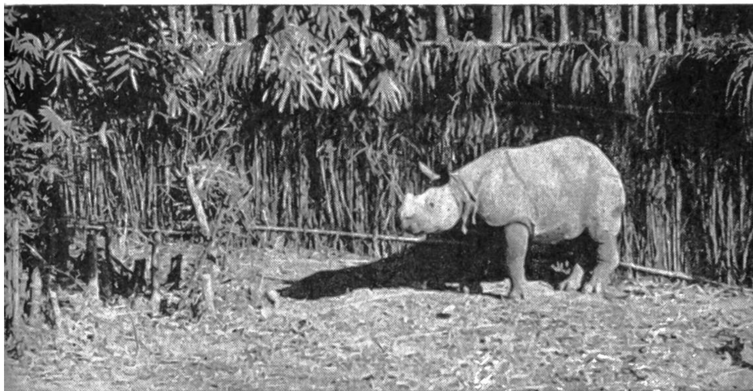
Das äusserst seltene, einhörnige, indische Panzernashorn nach dem Fang im Angewöhnungskraal in Assam.