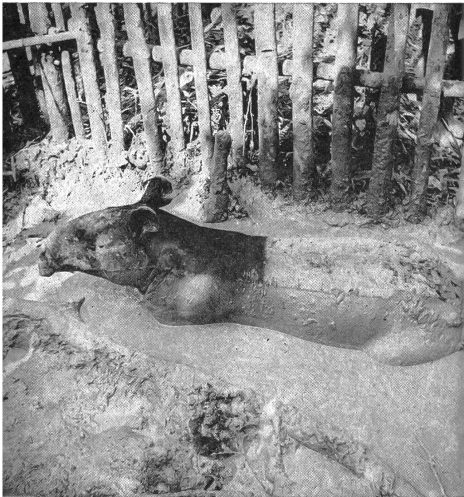
Frischgefangener Schabrakentapir im Schlammbad in Zentral-Sumatra.