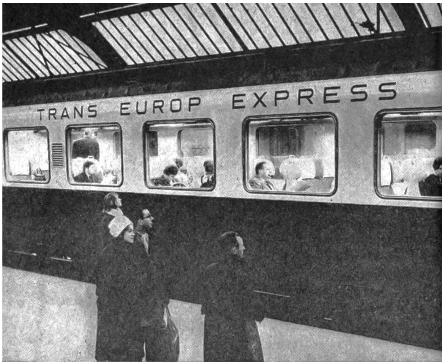
Der TEE-Zug – rasch, sicher und bequem.

noch von Dampflokomotiven gezogen wurden, wäre dies rein technisch möglich gewesen. Aber meistens wurde an der Grenze das Triebfahrzeug gewechselt, denn das Lokomotivpersonal jedes Landes wollte mit der «eigenen», ihm vertrauten Maschine fahren. Auch später, als die Eisenbahnlinien elektrifiziert waren und elektrische Lokomotiven eingesetzt wurden, wechselte man an der Grenze in der Regel die Lokomotive aus demselben Grunde: Der Lokomotivführer wollte «seine» Lokomotive, weil er nur bei ihr die Motoren, die vielen Apparaturen und Schalter gründlich kannte. In vielen Fällen hätte man aber mit der elektrischen Lokomotive gar nicht von einem Land in das andere fahren können, weil nämlich nicht alle Staatsbahnen die