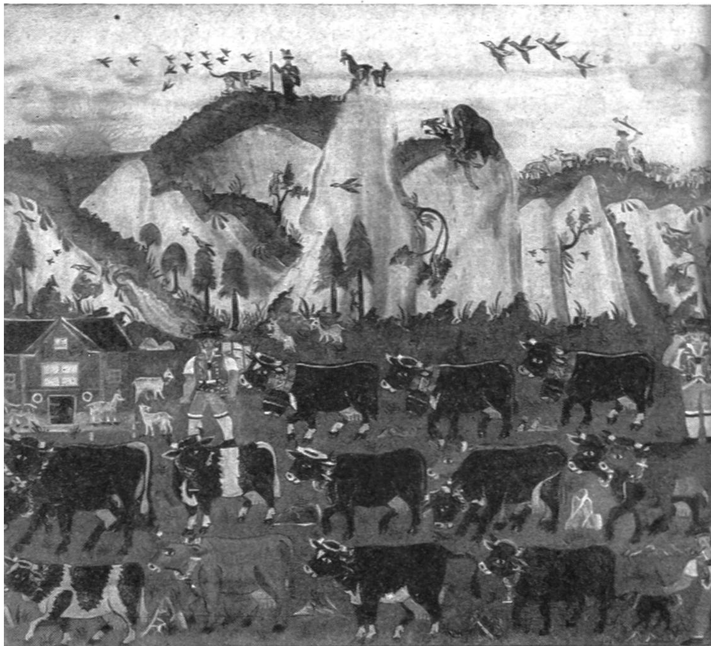
Bartholomäus Lämmli, Alpfahrt, 1854, Sammlung Max Wydler, Zürich.