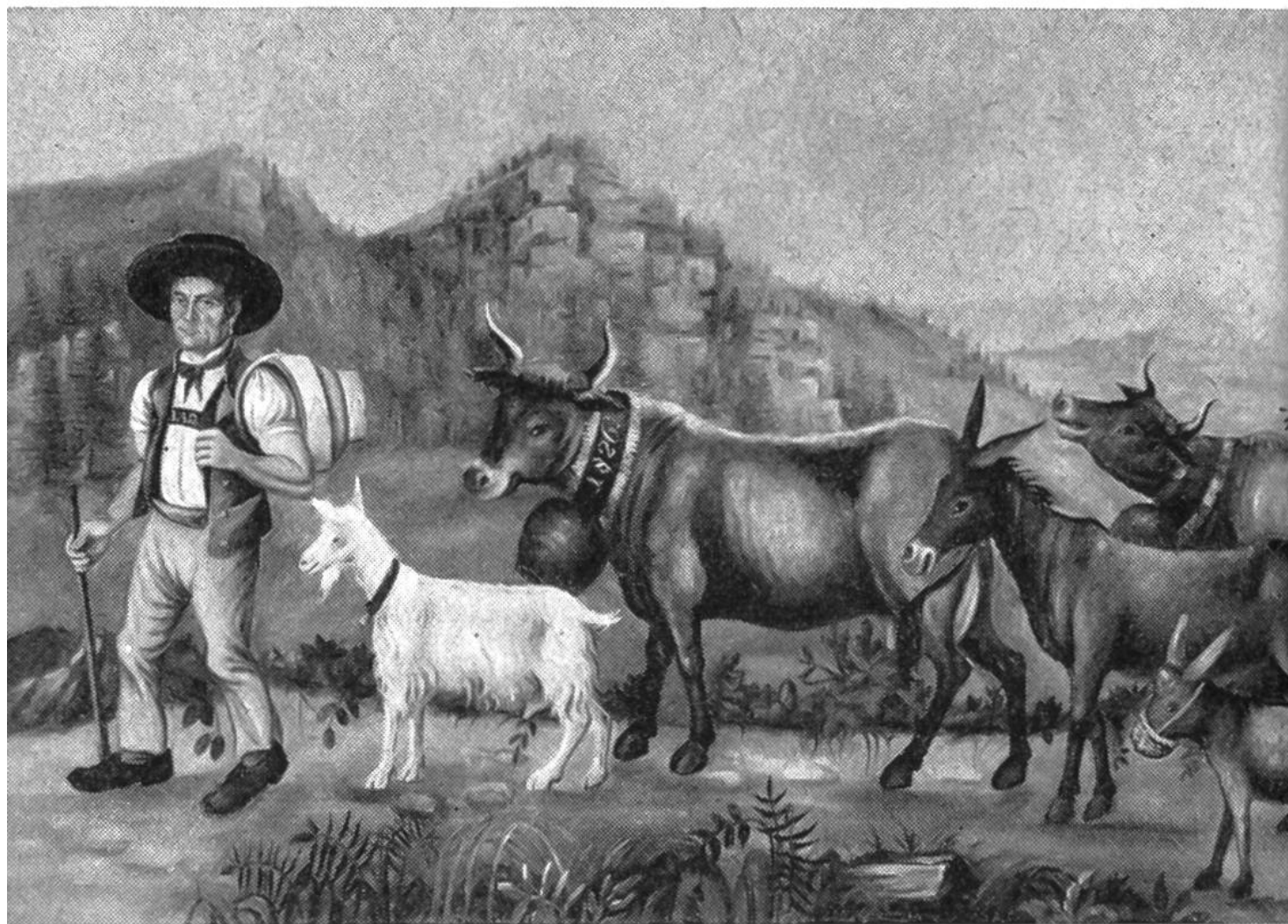
Unbekannter Künstler, Sennenbild, 1826, Toggenburger Heimatmuseum Lichtensteig.

sich eben eine Beute erjagt und schlägt seine Krallen in das arme Tier. Alles ist mit einer köstlichen Frische und Lebendigkeit wiedergegeben. Jede Perspektive fehlt, und statt nebeneinander sind die Kühe übereinander verteilt, damit jede einzelne genau gesehen werden kann.