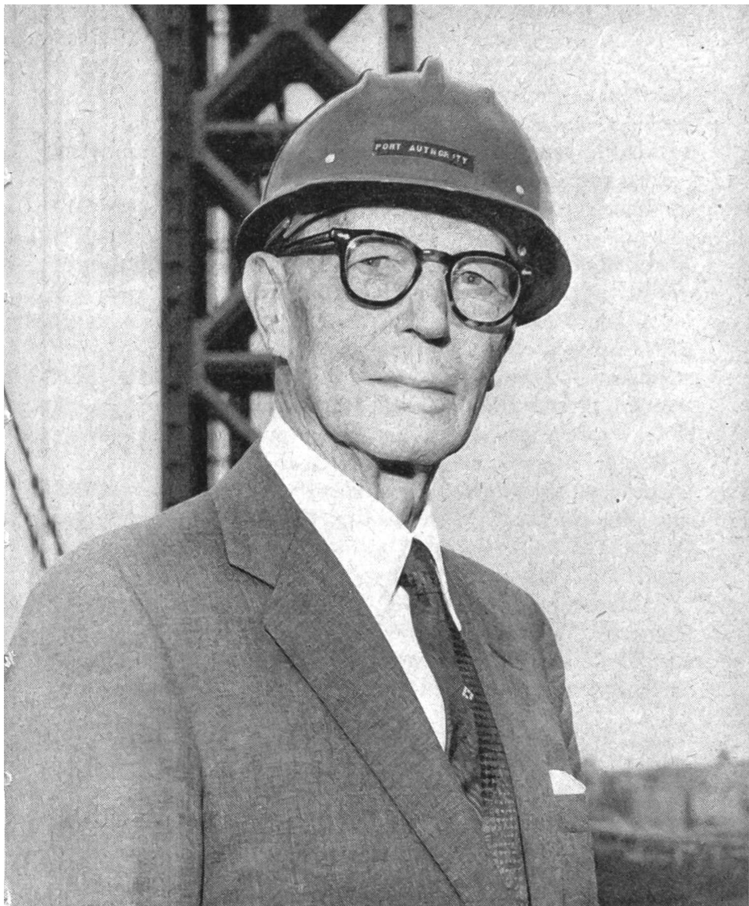
Othmar H. Ammann, der bedeutendste Brückenbauer der Welt, hat mit 85 Jahren sein Meisterwerk geschaffen, das als achtes Weltwunder bezeichnet wird: Die Verrazano-Narrows Bridge, die grösste Hängebrücke der Welt.