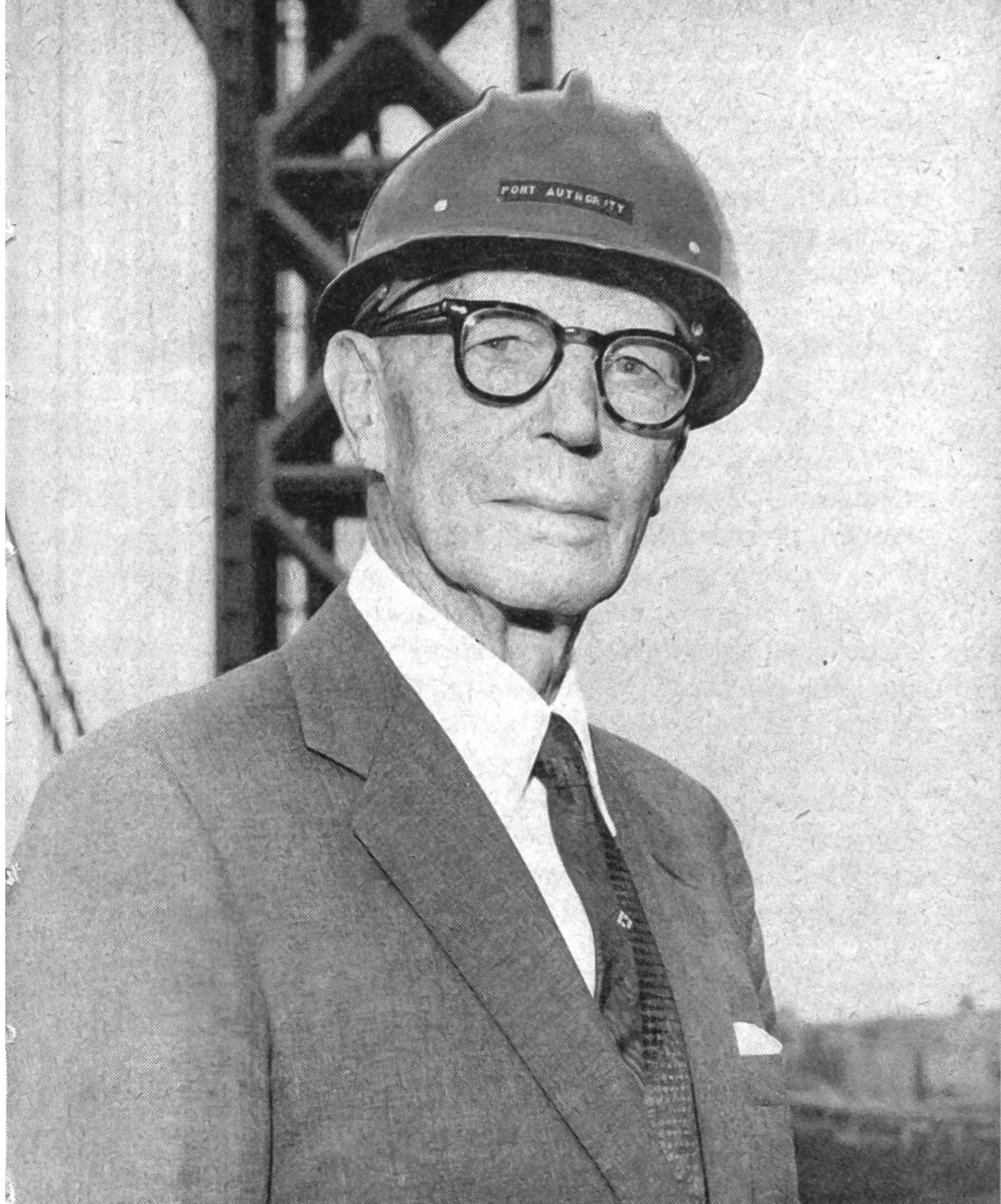
Othmar H. Ammann, der bedeutendste Brückenbauer der Welt, hat mit 85 Jahren sein Meisterwerk geschaffen, das als achtes Weltwunder bezeichnet wird: Die Verrazano-Narrows Bridge, die grösste Hängebrücke der Welt.