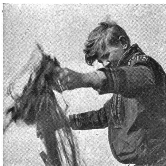
René Gardi Der Fremde am Tana