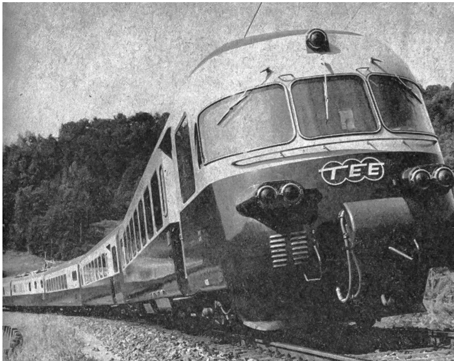
Der Vierstrom-TEE-Zug der SBB.

gleiche Stromart aufweisen. Die Schweizerischen Bundesbahnen – und zum grossen Teil auch die Deutsche Bundesbahn sowie die Österreichischen Bundesbahnen – verwenden Einphasen-Wechselstrom (15000 V 16\frac{2}{3} Hz). Die Italienischen Staatsbahnen dagegen fahren mit Gleichstrom (3000 V), die Französischen mit einem anderen Gleichstrom (1500 V) sowie mit Einphasen-Wechselstrom (25000 V 50 Hz). In Zentraleuropa sind für den Betrieb der elektrischen Hauptbahnen gegenwärtig nicht weniger als vier verschiedene Stromsysteme gebräuchlich. Alle vier reichen bis an die Schweizergrenze.