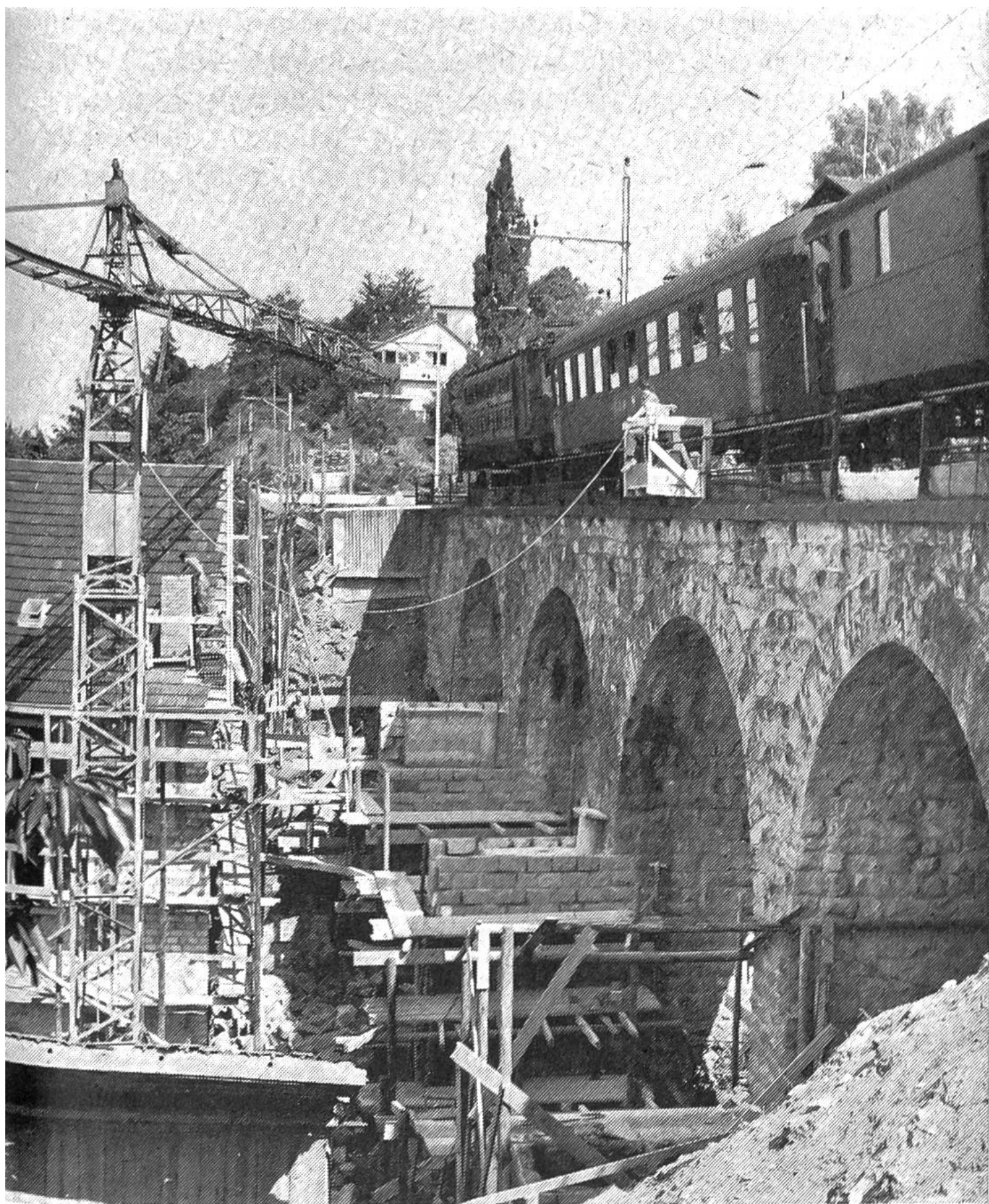
Verbreiterung des Viaduktes «Pfarrgasse» an der Strecke Erlenbach-Herrliberg/Feldmeilen.