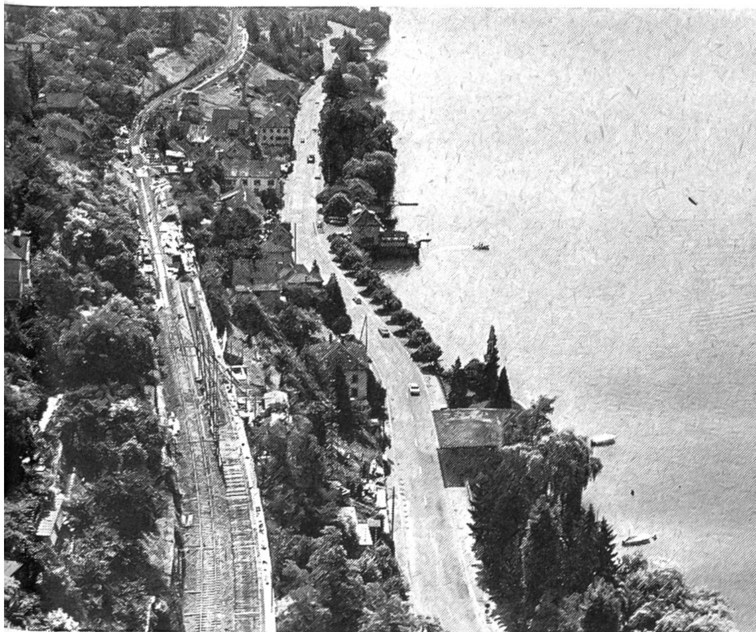
Zwischen Erlenbach und Herrliberg/Feldmeilen, an der Seehalde, wird ein Lehnenviadukt gebaut, damit ein zweites Geleise gelegt werden kann.