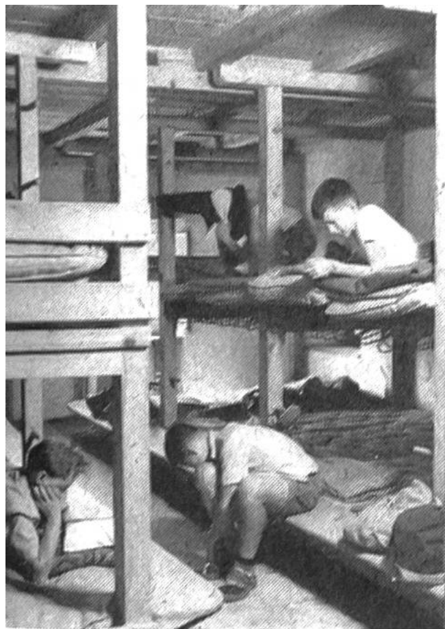
Im geräumigen Bubenschlafrum.