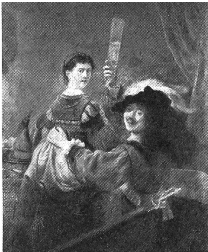
Rembrandt (1606–1669): Selbstbildnis mit Saskia, 1634. Öl auf Leinwand. Gemäldegalerie Dresden.

seiner Krönung (1804) für seine Untertanen im Krönungsornat malen liess. Der Stab mit dem Adler, der Reichsapfel, der Lorbeerkranz, die Adlerkette und der kostbare Hermelinpelz sind die offiziellen Abzeichen der neuen, selbsteroberten Würde. Der Körper ist in den prächtigen Gewändern kaum zu erkennen, der Gesichtsausdruck kalt und abweisend. Napoleons Gesicht ist wie eine Maske; seine Persönlichkeit tritt ganz hinter das hohe Amt zurück. Solche Bildnisse des Kaisers waren damals in vielen offiziellen Gebäuden zu sehen; die Franzosen sollten durch das gemalte Abbild an die Macht des Herrschers erinnert werden. Das abgebildete Gemälde wurde wahrscheinlich vom Hofmaler Napoleons, François Gérard, geschaffen. Gérard malte verschiedene Napoleon-Bildnisse, wovon das unsere eines der prächtigsten ist. Es gehört dem schönen Napoleon-Museum Arenenberg im Kanton Thurgau.