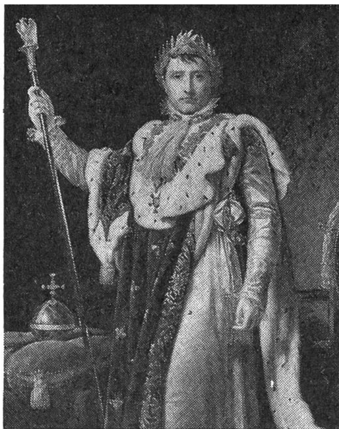
François Gérard (1770–1837): Napoleon im Krönungsornat, nach 1804. Öl auf Leinwand. Napoleon-Museum Arenenberg.