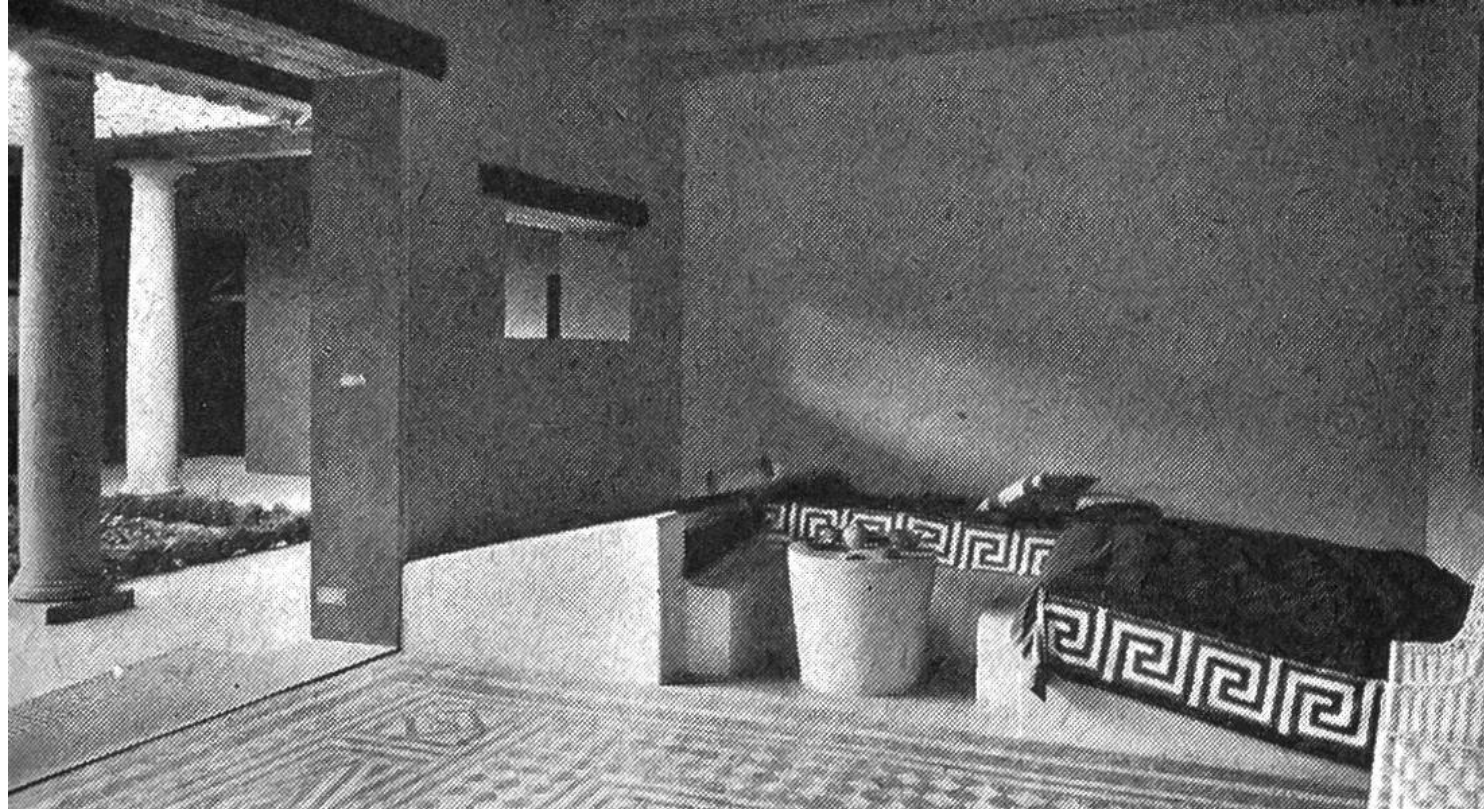
Esszimmer, Römerhaus Augst

Die Amphoren dienen auch als Transportgefässe, sie sind daher auf all den grossen, stark belebten Handelsstrassen, den vielen Schiffen und in den imposanten Häfen anzutreffen.