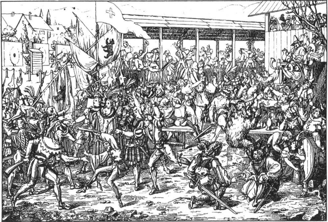
Fasnachts- und Schützenfest in Zürich um 1450.

Wichtigster Teil der Unterhaltung war der «Glückshafen», die Schützenfestlotterie, die viele Leute anzog. Für einen Kreuzer erhielt man einen Zettel, auf den man seinen Namen schreiben musste. Diese Zettel wurden in einen Topf geworfen, in einen andern die Zettel, auf denen die Gewinne notiert waren. Zur Ermittlung der Gewinner zog jemand gleichzeitig aus beiden Töpfen je einen Zettel. Von jedem Gewinn musste ein kleiner Teil abgegeben werden. Davon wurden die Festunkosten bezahlt, etwa Zeiger und Spielleute. Das Freischiessen von 1504 endete mit «Offenen Spielen», Wettbewerben im Laufen, Springen und Steinstossen. Das waren aber keine ernsthaften sportlichen Wettkämpfe, sondern zusätzliche Volksbelustigungen, wie schon die geringen Siegespreise verraten. – Wenige Jahrzehnte nach dem grossen Zürcher Freischiessen brachen unter den Eidgenossen die bitteren Glaubenskämpfe aus; die Zeit für freundschaftliche Schützentreffen war damit vorbei. Andreas Kappeler